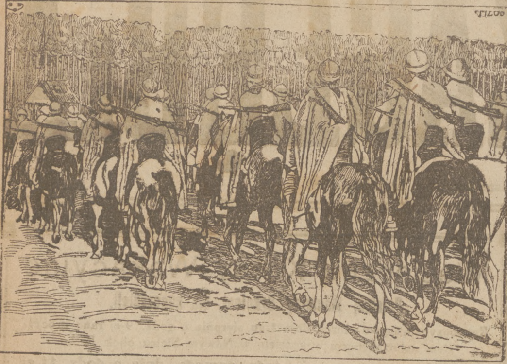
Francuska kawalerja w hełmach stalowych na nowowynalezionych siodłach.

Rosjanie ponowili swe ataki znacznymi silami. Sześć razy atakowali oni daremnie wczoraj popołudniu dwoma korpusami front Skrobowa-Wygoda (na wschód od Horodyszcz). Dalsze ataki toczą się. Kilkakrotnie cofnęły się fale atakujących dwóch dywizji przed naszymi pozycjami nad Szczarą na północ-zachód od Lachowicz. Straty nieprzyjaciela są bardzo ciężkie.