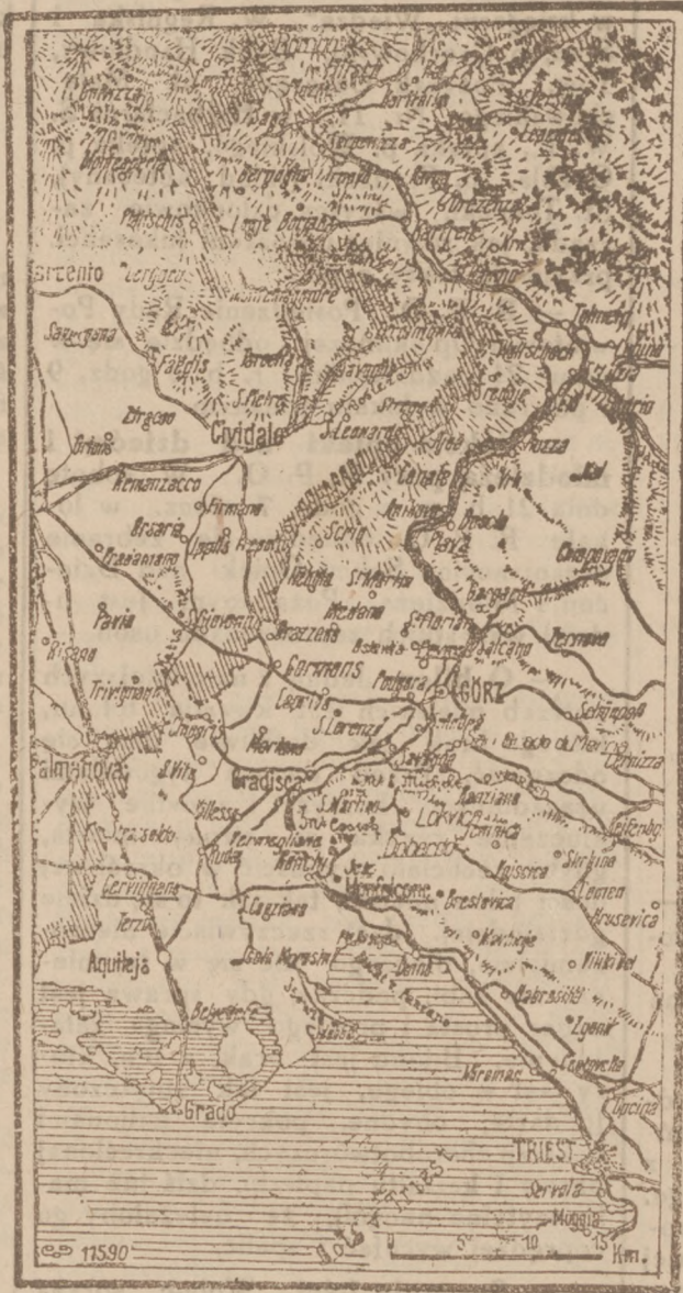
Z walk nad Isonzo.

Potrzebni chłopcy lub dziewczynki do roznoszenia gazet Zgłaszać się do Administracji „KURJERA ZAGŁĘBIA”.