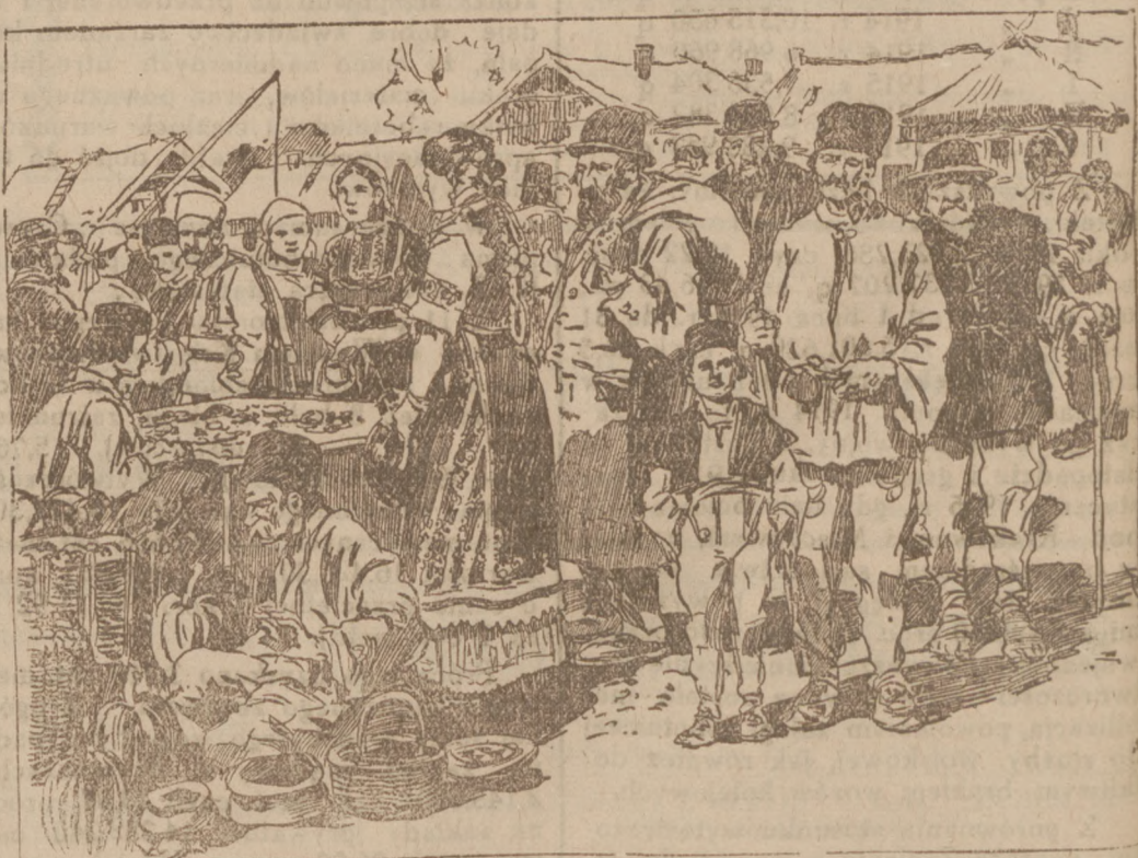
Typy ludowe w Rumunii. Na targu w małej miejscinie.

„Główną przyczyną odwrotu wojsk rumuńskich z Transylwanii była przewaga wojsk austriacko-niemieckich. Obecnie znaczne posiłki wysłano na front i pozycje nasze, zajęte ostatnimi czasami, są pomimo naporu nieprzyjaciela, w naszym ręku.