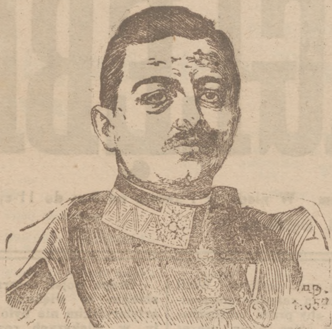
KAROL I, cesarz austriacki, król węgierski.

odbył świeżo kilka z rzędu narad w Kijowie w związku z wypadkami na rumuńskim terenie wojny.