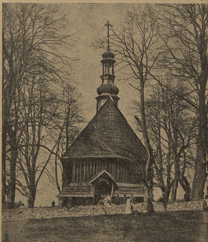
Kościółek na Obidowej