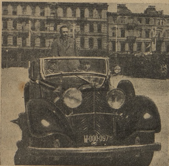
PREZYDENT R. P. BOLESŁAW BIERUT

„Automobilklub Polski – Nadrzędna Organizacja Sportu Motorowego i Turystyki — to Stowarzyszenie, mające na celu spółdziatanie z czynnikami państwowymi na polu krzewienia motoryzacji Państwa, oraz pracujące społecznie, wychowując nowe pokolenie kierowców”