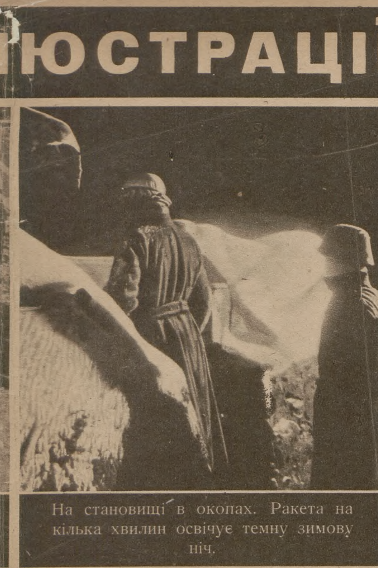
На становищі в окопах. Ракета на кілька хвилин освічує темну зимову ніч.