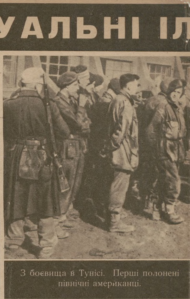
З боевища в Тунісі. Перші полонені північні американці.