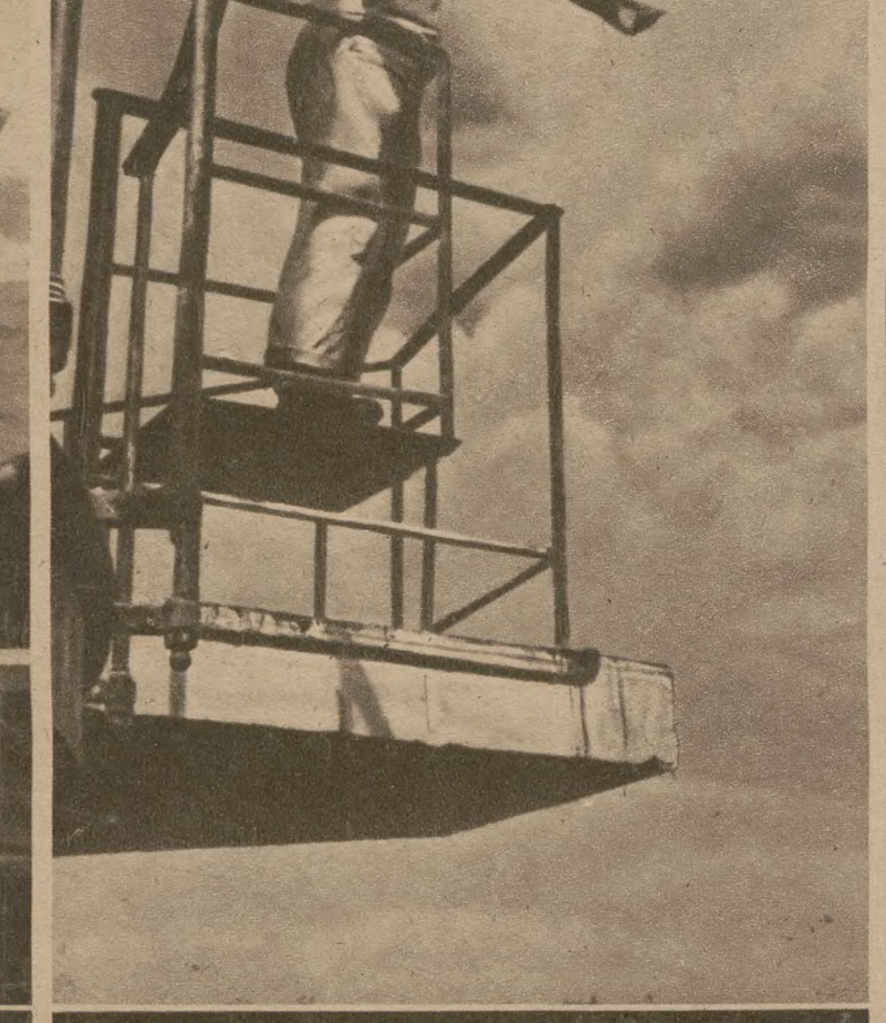
Передають сигнали прапорами з вежі на вежу на Атлантицькому побережжі.

Прославлена перемога англійців й американців у північно-західній Африці з характеристичною швидкістю розпалася на деякі дуже сумнівної вартості складові частини. Між обидвома „державами-окупантами” розгорнулася палка конкурентна боротьба. Виявилось, що зрадницький француз адмірал Дарлян — це тільки знаряддя в руках північно-американських плотократів, які хочуть заволодіти земними скарбами дотеперішніх західних і північних колоній в Африці. Англійський же уряд вважає, що його зовсім відсунено на бік. Піддержуваний ним зрадницький француз де Голь повернувся до свого помешкання в Лондоні та звідтіля бездільно й почувачись ображеним приглядається розвиткові подій. Тимчасом із Тунісу з щораз більшою силою підступає німецько-італійський корпус.