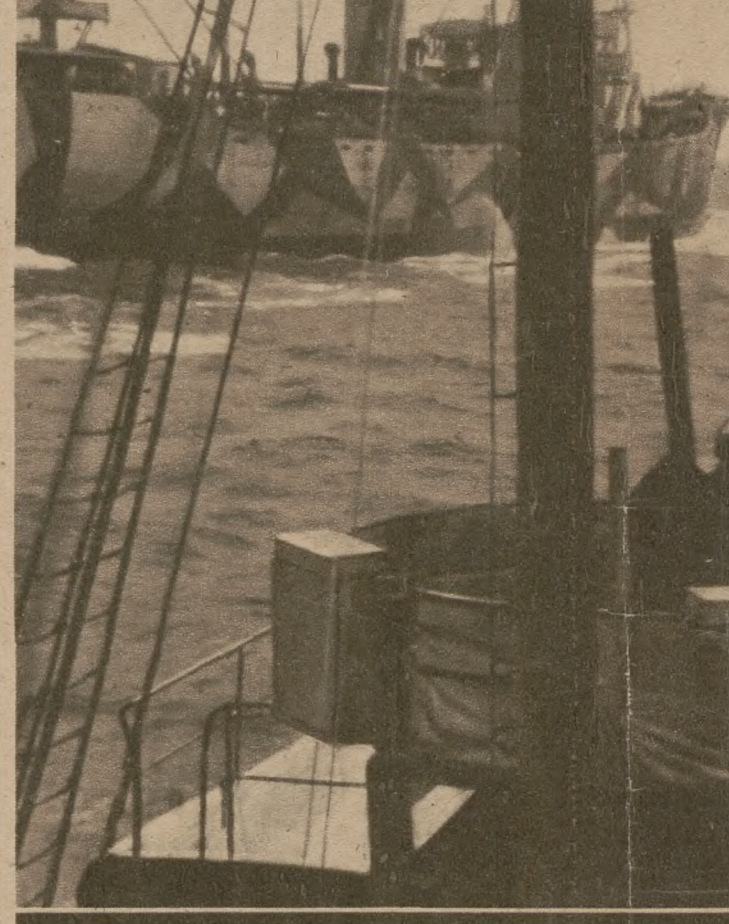
Під охороною конвою безпечно пливе собі цей німецький транспортний корабель до визначеної пристані.