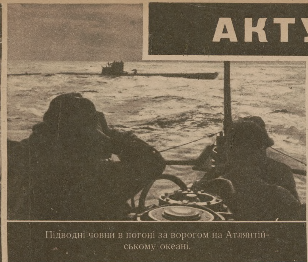
Підводні човни в погоні за ворогом на Атлантицькому океані.