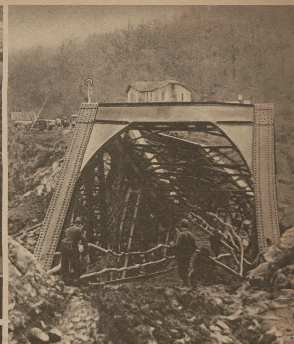
Висаджені в повітря мости не в силі припинити постачання. Німецькі сапери вміють собі порадишити.