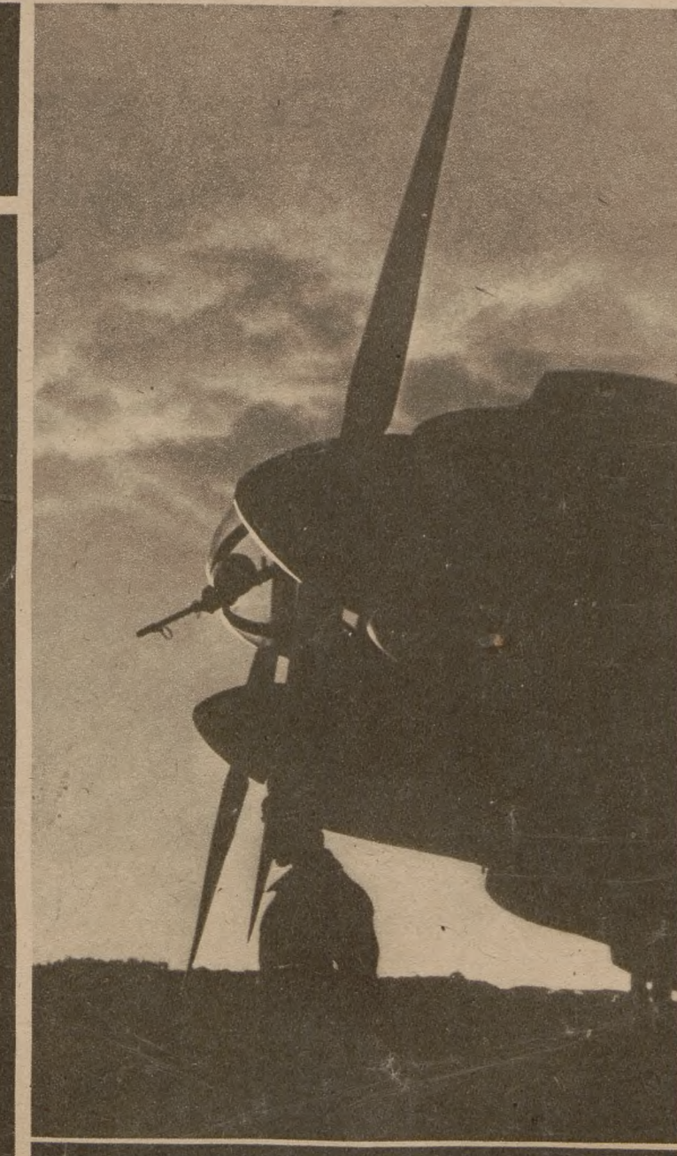
Старт бойового літака на світанку. Кілька разів удень вилітає він проти большевиків.

Під вражінням повідомлень із західної Африки про нібито велику перемогу, совітська армія з свого боку виступила до кількох офензивних акцій. Ці офензивні дії мусіла вона переплатити велетенськими жертвами. Дивізії за дивізіями розбивала німецька оборона. Як подало до відома німецьке воєнне звітлення, від 1-го по 10-е грудня перед німецькими лініями знищено багато більше, як тисячу совітських повзів. Тимчасом біля Торонца окружено й доценту знищено ще одну совітську ударну групу.