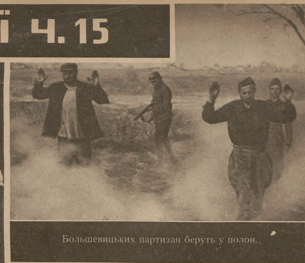
Большевицьких партизан беруть у полон.