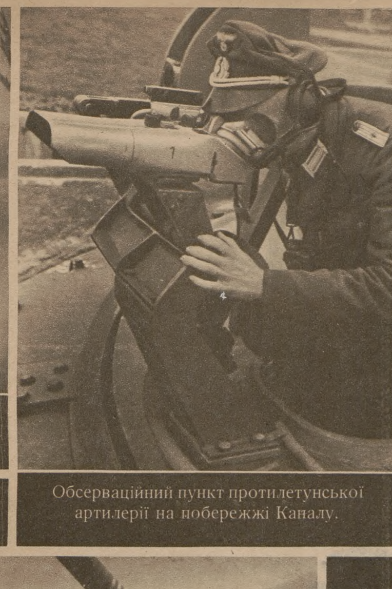
Обсерваційний пункт протилетунської артилерії на побережжі Каналу.