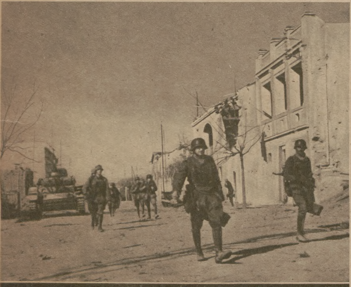
Перша поразка північних американців у Тунісі. Приступом узято Тебурбу.