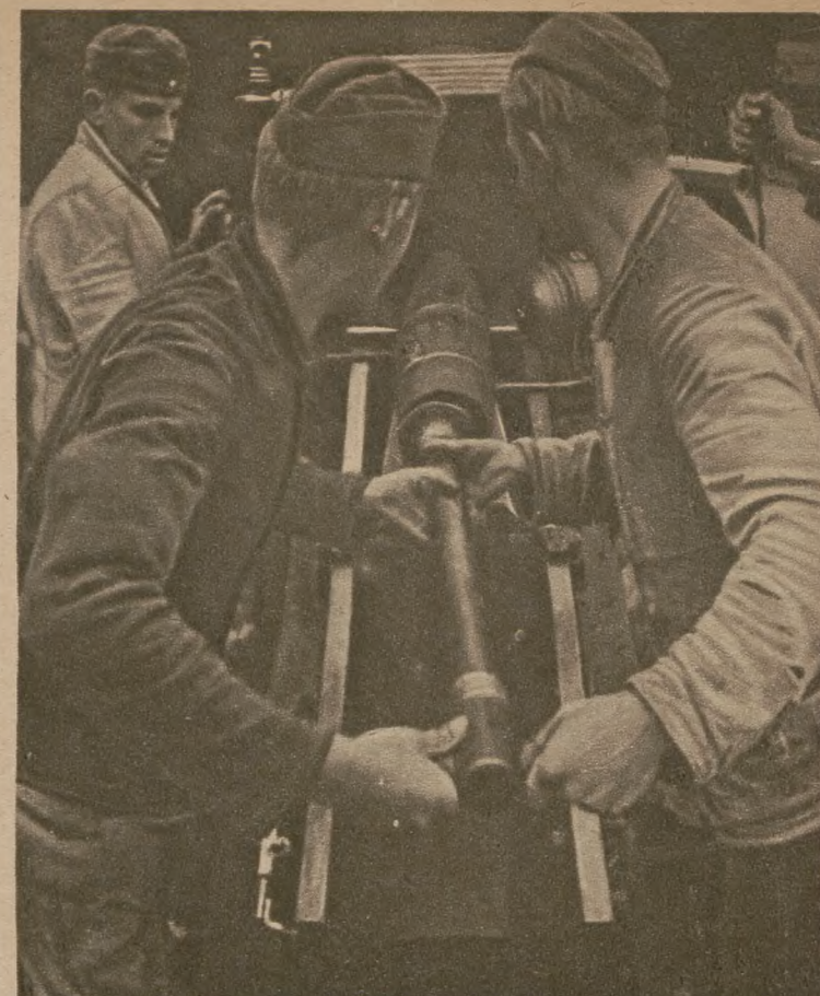
Ще мить і ця граната передасть смертоносний привіт большевикам.