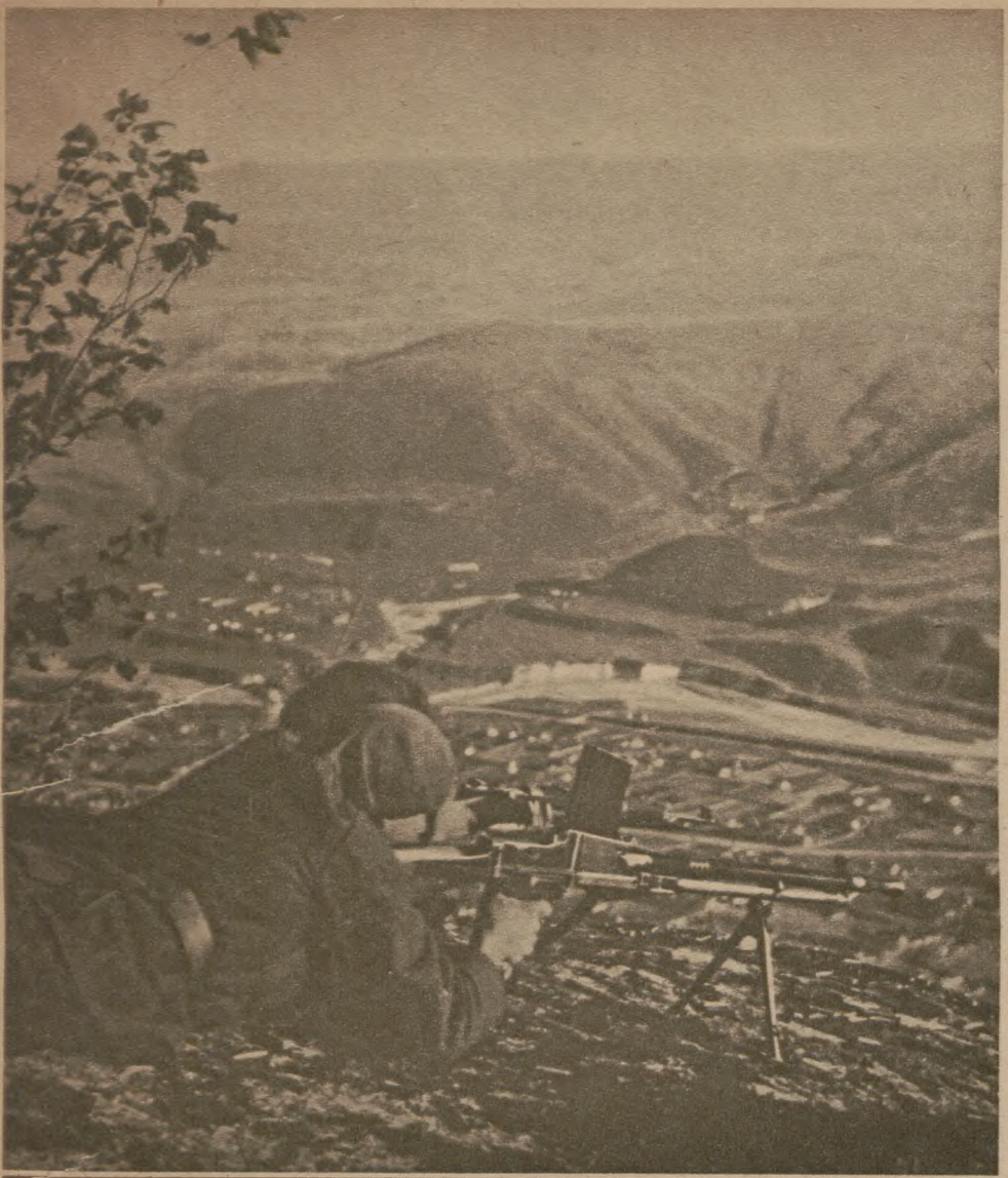
Краєвид на Кавказі. Тут гірські стрільці мають добре поле обстрілу.