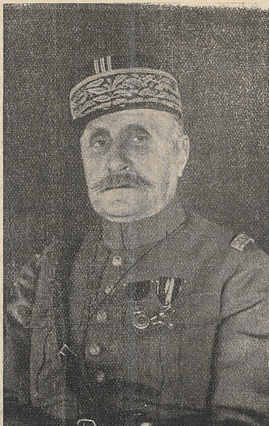
Ś. p. Ferdynand Foch.