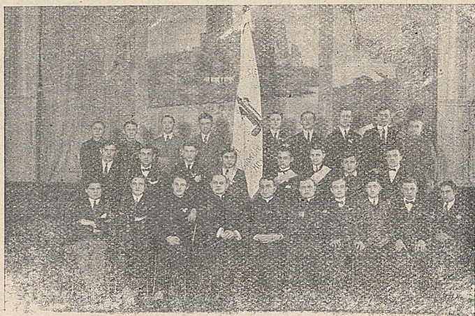
Sodalicja będzińska z nowoposwieconym sztandarem.

ciowe kazanie wygłosił X. Mod. Kasprzak. Po Mszy św. przy dźwiękach orkiestry udano się na „Górę Zamkową“, gdzie z racji poświęcenia sztandaru odbyło się wbijanie gwoździ pamiątkowych przez Duchowieństwo, Sodalicję Marjańskie, Stowarzyszenia żeńskie i męskie,