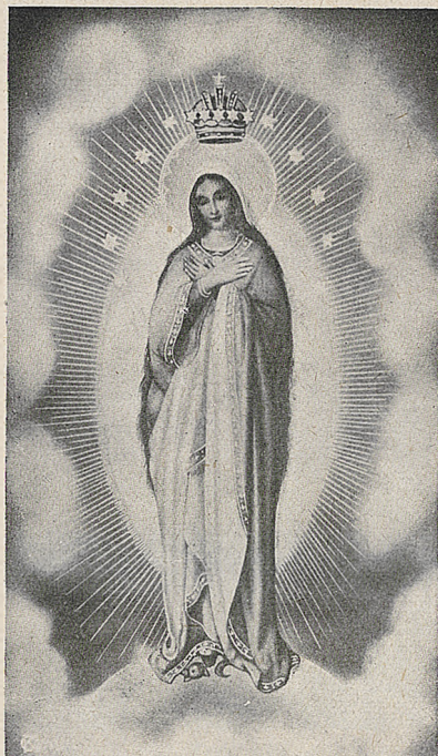
Niepokalana Patronka Sodalicji.