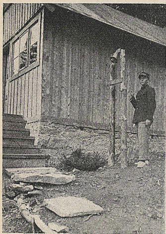
Dyżurny «Łańcut» dzwoni na Mszę świętą.