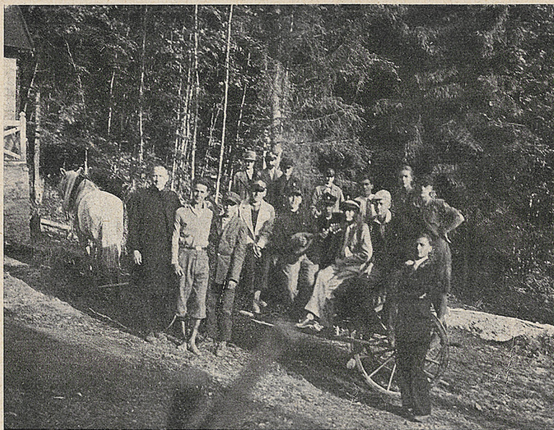
Pierwsi koloniści przyjechali na Śnieżnicę! (9 lipca 1930).