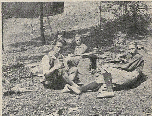
Można i tak! Sodalisi-harcerze z Zakopanego przyszli piechotą z Tatr na Śnieżnicę i gospodarują «na swój koszt», zbudowawszy harcerską kuchnię polową.