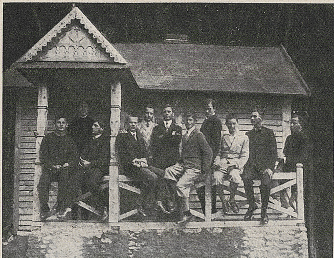
Nasi koloniści przed «plebanijką» (tak nazwano mieszkanie X. Kierownika Kolonii).