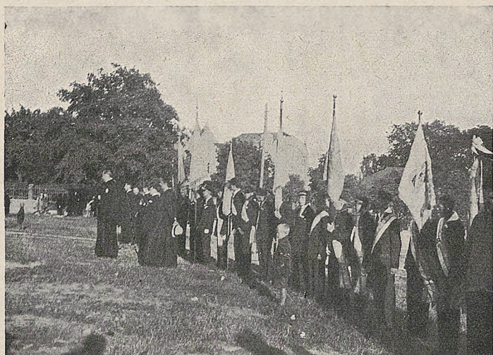
II. Kongres Związku w Częstochowie 2-go lipca 1930. Poczty sztandarowe (część). Przed nimi X. Prezes Związku i XX. Moderatorzy.