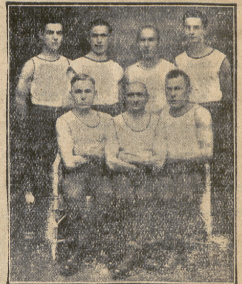
Grono techniczne „Sokoła” IV.