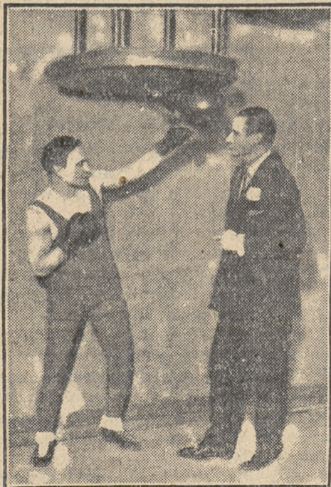
Lekcje bokserstwa udzielane przez zawodowych pięściarzy członkom bogatych rodzin w Nowym Joiku.

Oprócz tego, K. S. Gryf organizuje specjalny kurs gier sportowych pań (koszykówka, hazena i siatkówka), który ma się odbyć w niedzielę od godz. 14-16