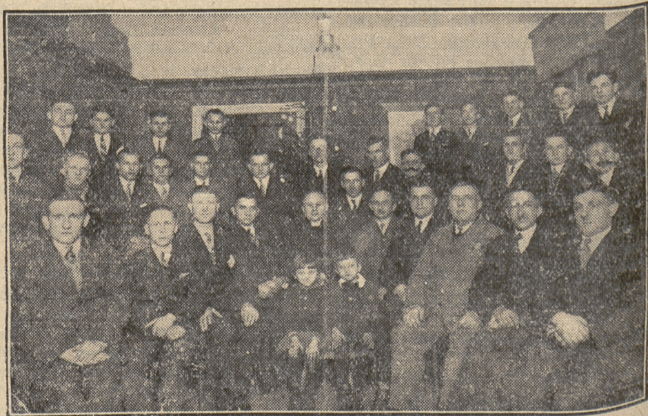
Uroczystość gwiazdkowa Tow. Gimn. Sokół w Nakle.

prezesa K. S. „Bydgoszcz”. Osoby, znające adres wyżej podanych, proszone są o łaskawe zakomunikowanie firmie.