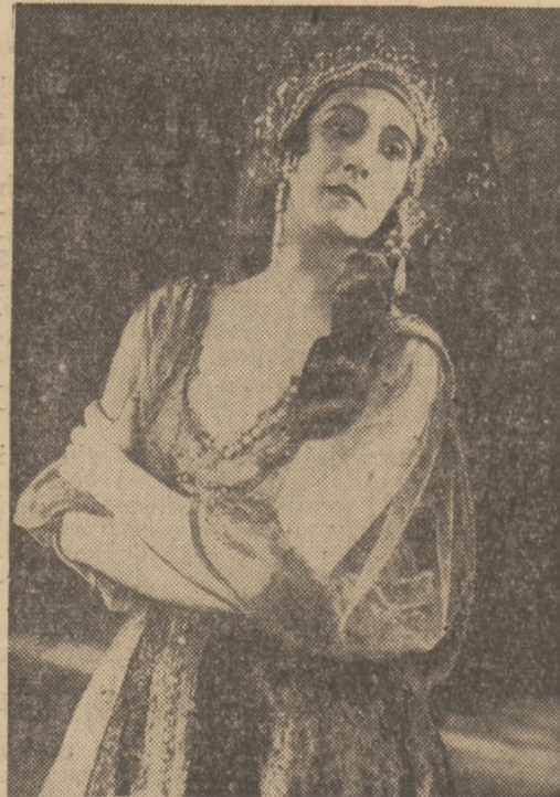
Karsawina — gwiazda baletu rosyjskiego.

Wreszcie dzień 21 stycznia 1772 roku przyniósł przełomowe, choć w swej istocie komiczne zdarzenie. W wystawionej wówczas operze Rameau: „Kastor i Polluks” Gaetano Vestris miał w piątym akcie odtańczyć wkładkę baletową, przedstawiającą wkroczenie Apolla. Za strój miała mu służyć wielkich rozmiarów peruka i maska oraz słońce z miedzianej blachy na pierśsiach. Vestris po przywdzianiu tego ciężkiego kostjumu... zemdlął. — Ponieważ nie zdołano go przywrócić na czas do przytomności, uproszono sławnego podówczas baletmistrza Gardela, by zastąpił niedys-