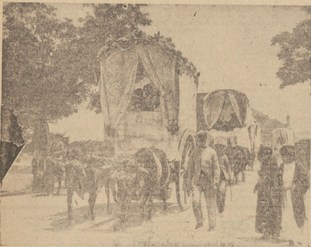
Zielone Święta w Andaluzji.

(Ol.) Aż do mostu, który jest przerzucony przez Guadalquivir, a który prowadzi od Sewilli do portugalskiej granicy, staje się człowiek niewolnikiem przeszłości bogatej, rzeczywistej, którą można sobie uzmystowić!