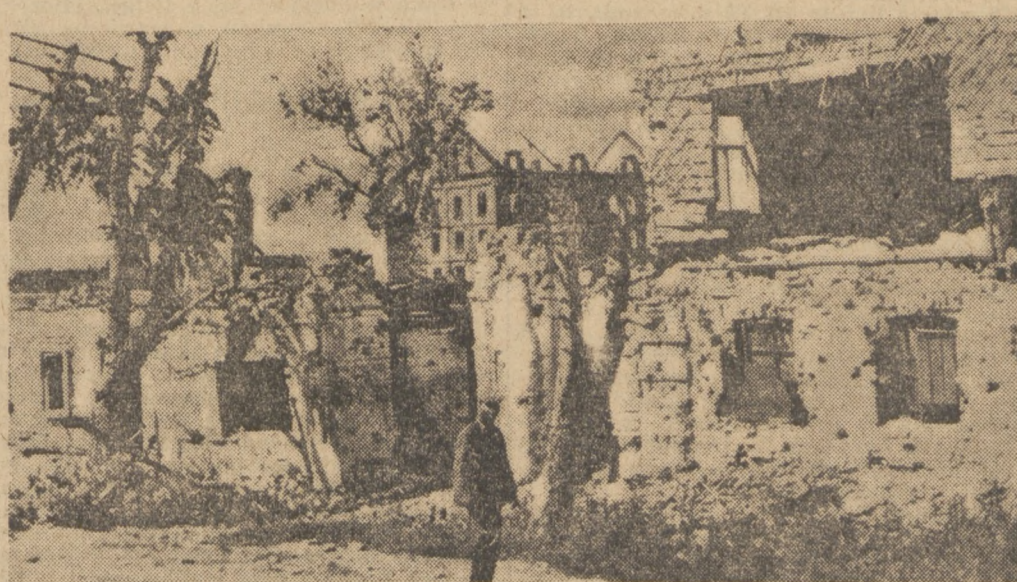
Tak wygląda Belgrad. Każda ulica, każdy dom i każde drzewo noszą ślady wielkiej bitwy.