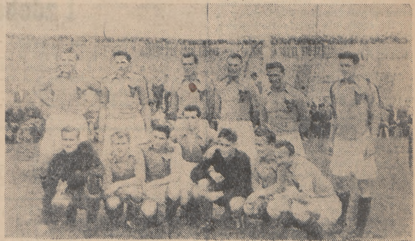
Reprezentacja Mor. Ostrawy przed meczem z Krakowem.