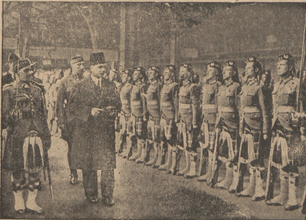
Przed wyjazdem do Egiptu król Faruk dokonał w Doyer przeglądu kompanji góralskiej.

„Niemcy witają rezolucję 4 milionów francuskich żołnierzy frontowych, wzywającą do współpracy nad utrzymaniem honorowego pokoju, gdyż życzenie to pokrywa się (!) z podstawami niemieckiej polityki pokojowej.