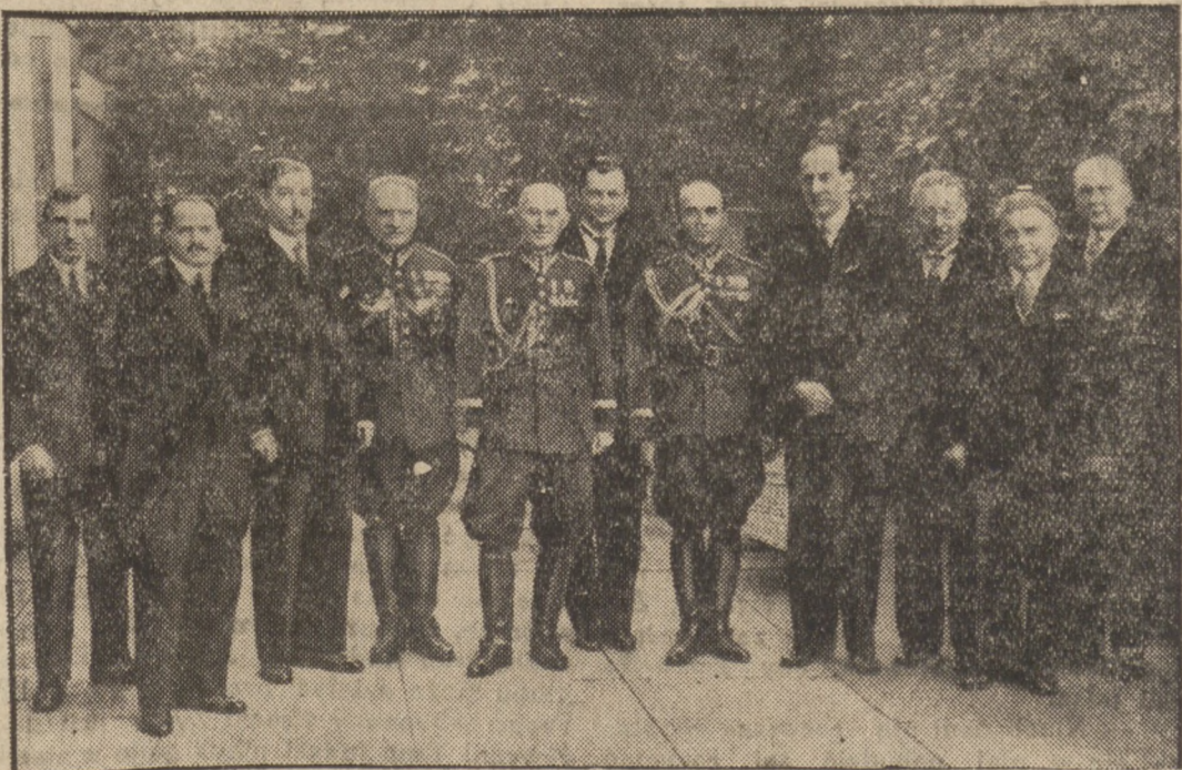
Rząd premiera Składkowskiego u Generalnego Inspektora Sił Zbrojnych gen. Rydza-Śmigłego. Stoją od lewej: min. rolnictwa — Poniatowski, min. op. społecznej — Kościółkowski, min. skarbu — Kwiatkowski, premier gen. Składkowski, gen. Rydz-Śmigły, min. sprawiedliwości — Grabowski, min. spraw wojskowych — Kasprzycki, min. spraw zagr. — Beck, min. oświaty — Świętosławski, min. komunikacji — Ulrych, min. poczt i telegr. — Kałński.

„Składajcie ofiary na Naczelny Komitet Uczczenia Pamięci Marszałka J. Piłsudskiego konto P.K.O. 1313”.