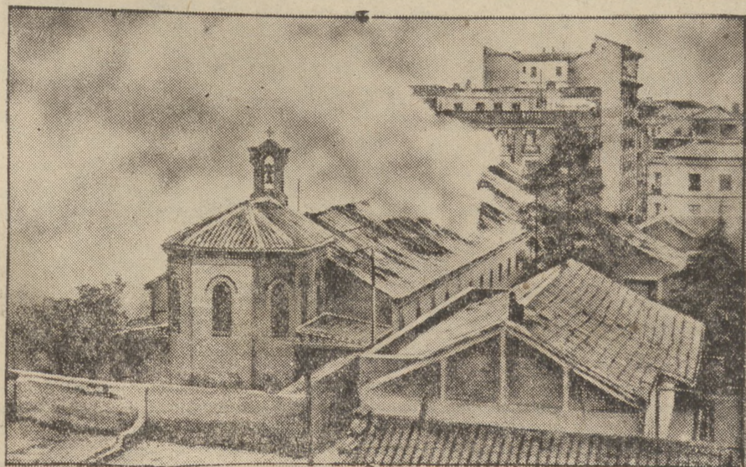
Ogarnięty płomieniami kościół na przedmieściu Madrytu stolicy Hiszpanji podpalony przez komunistów:

Jest to czwarty w Polsce po wprowadzeniu kontroli dewizowej wypadek aresztowania pod zarzutem handlu złotem.