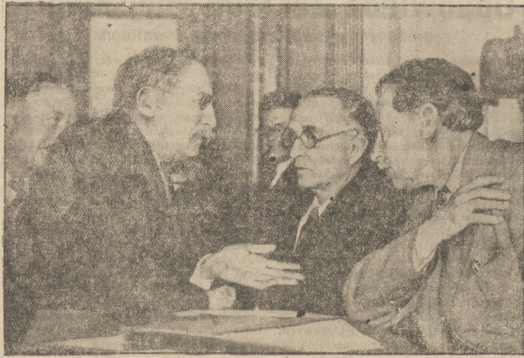
Przywódca socjalistów francuskich — Leon Blum.

W miejscu lądowania balonów odpowiednie urzędy pocztowe zaopatrzą przesyłki przewiezione balonami, datownikiem urzędu pocztowego i prześlą je do miejsca przeznaczenia zwykłą drogą pocztową.