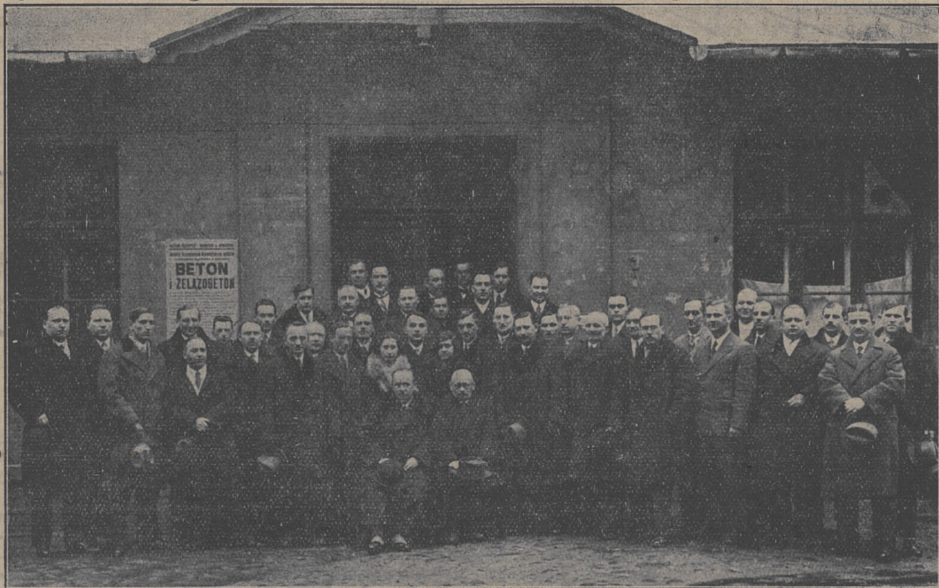
Uczestnicy II kursu dla pracowników komunalnych kas oszczędności.