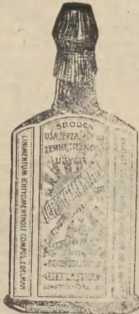
Flaszka bez opakowania.