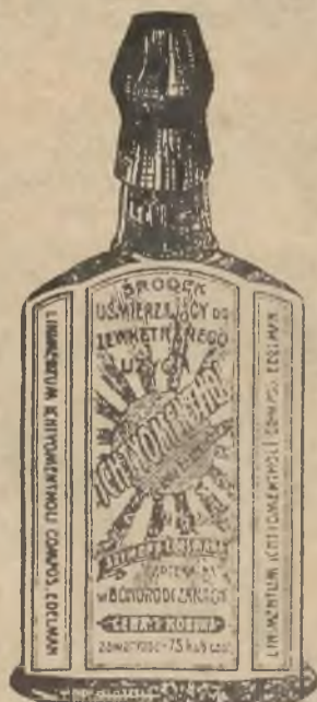
Flaszka bez opakowania.