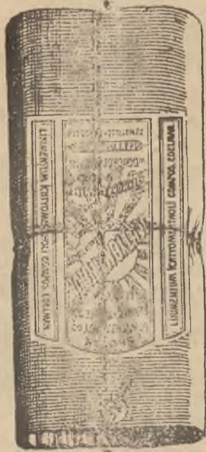
Flaszka w oryginalnem opakowaniu.