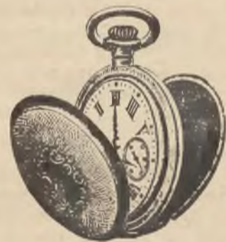
Tylko koron 8.