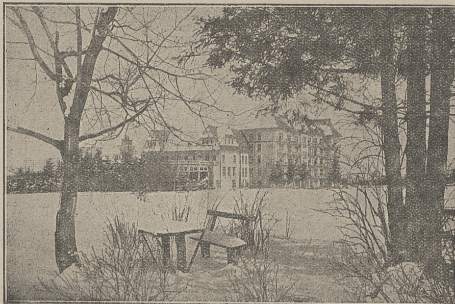
Sanatorium Polskiego Czerwonego Krzyża w Zakopanem.

Przykry nastroj, jaki wytworzył się po klęsce wylewów, powoli mija i życie Krynicy płynie normalnie. — Komunikacja kolejowa przywrócona a nawet uruchomiony został dodatkowo bezpośredni pociąg z Warszawy. Dzięki temu napływ gości z każdym dniem wzrasta. Ceny mieszkań i utrzymania utrzymują się na poziomie wiosennego sezonu w granicach od 7 złotych od osoby dziennie za pełny pensjon.