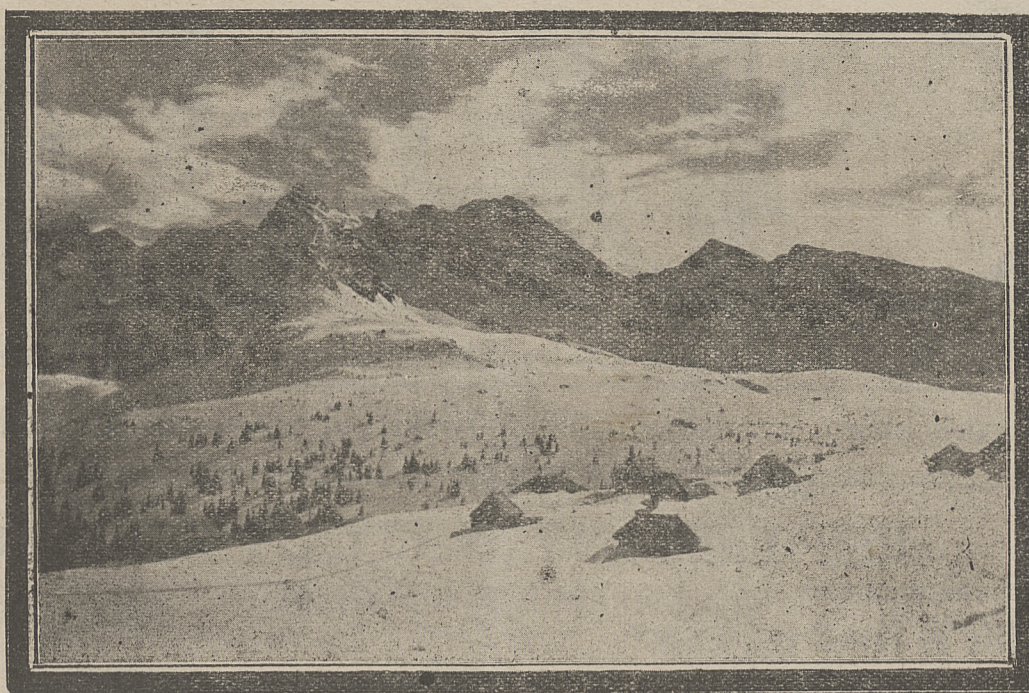
TATRY: HALA GĄSIENICOWA.

Klimat Zakopanego jest wybitnie górski kontynentalny, z dużymi wahaniami ciepłoty między latem i zimą, dniem i nocą. Klimat ten wywiera na ustrój ludzki wpływ dodatni, podnieca przemianę materji, zwiększa łaknienie,