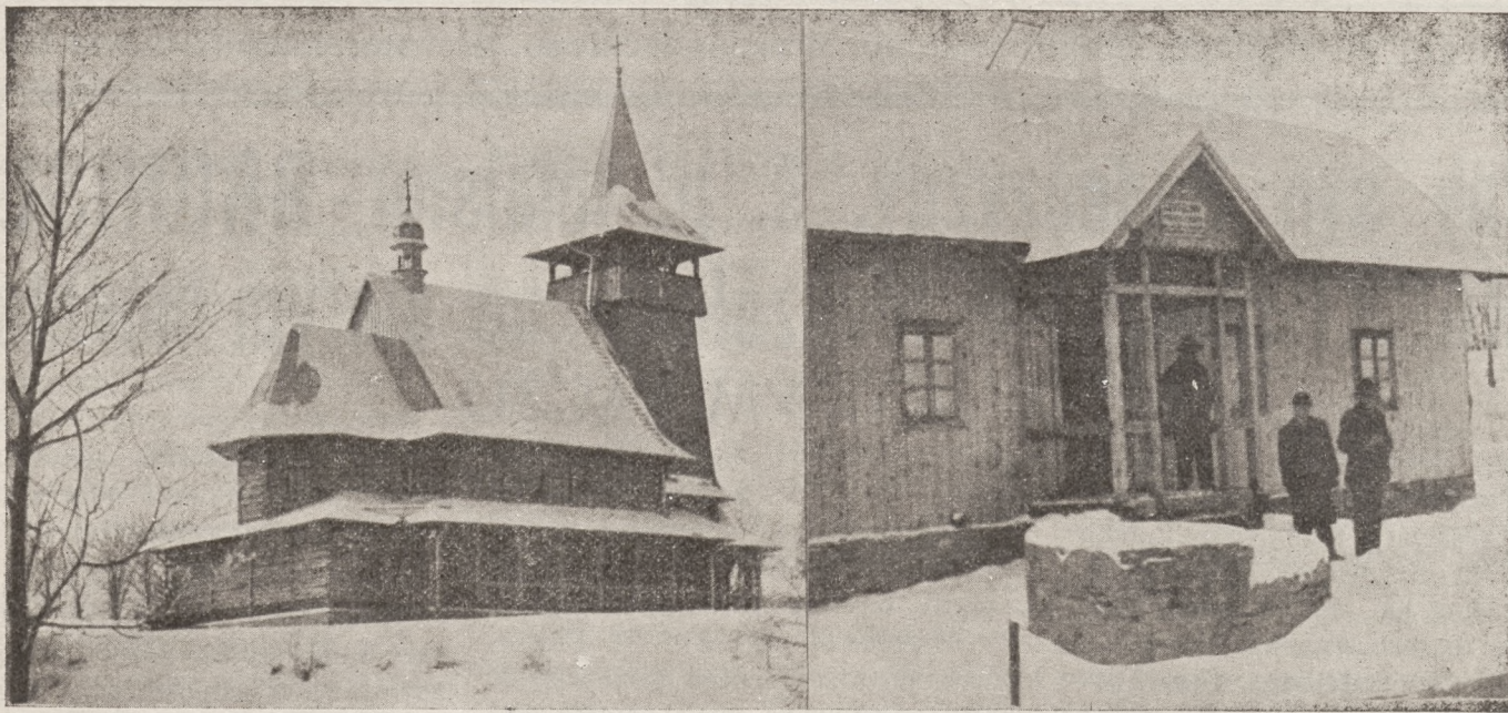
Nowowbudowany kościółek rzym.-kat. w Łabowej