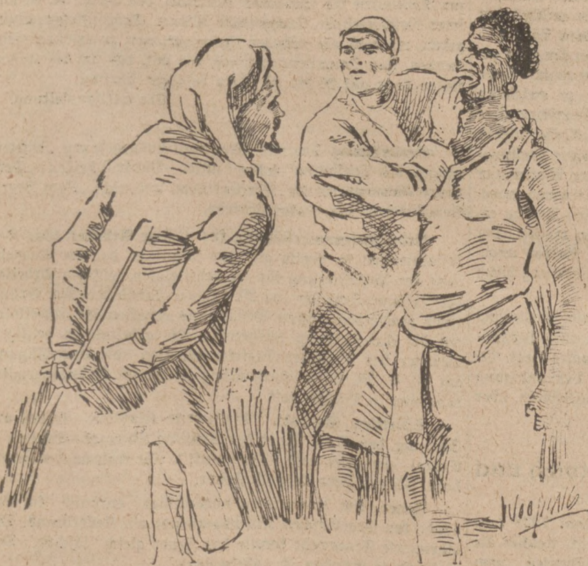
Die Brautschau! Hier wird niemals eine Kage im Sack gekauft

„Einen besseren?“ bemerkte ich. „Vielleicht. Aber sie gehört noch immer mir; ich habe sie ja