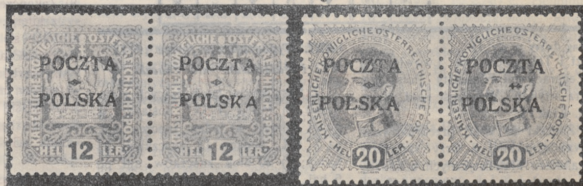
Znaczki 49 i 50 formy „F. VII“.

KAŻDY FILATELISTA LWOWSKI POWINIEN BYĆ CZŁONKIEM „LWOWSKIEGO ZWIĄZKU FILATELISTÓW“.