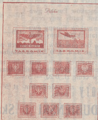
tak wygląda kartka z naklejonymi znaczkami

KUPON upoważniający do zamieszczenia ogłoszenia złożonego z 20-tu słów w numerze 88 „I. K. F.“. Przy przesyłaniu powyższego kuponu należy dołączyć 1 zł, każde następne słowo 10 groszy. — Ogłoszenia przyjmuje się do 5-go maja 1932 r.