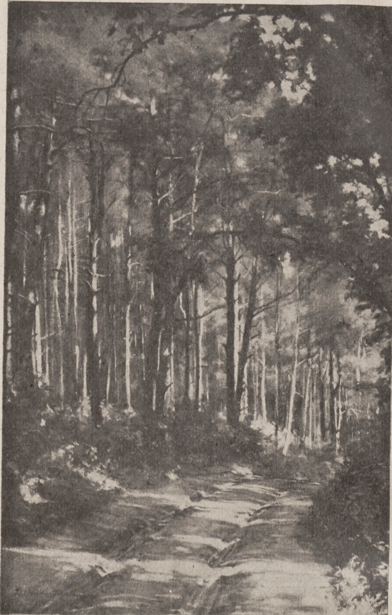
Zdjęcie powyższe jest reprodukcją obrazu olejnego pt. „Las“ pędzla znakomitego artysty-malarza Bolesława Barbackiego. Ostatnio prasa codzienna i fachowa Polski i zagranicy rozpisuje się niezwykle pochlebnie o sztuce tego artysty.

znajemy na widok lasu, ciszę i spokój w tym lesie znajdziemy a także i zdrowie w zapachach leśnej żywicy.