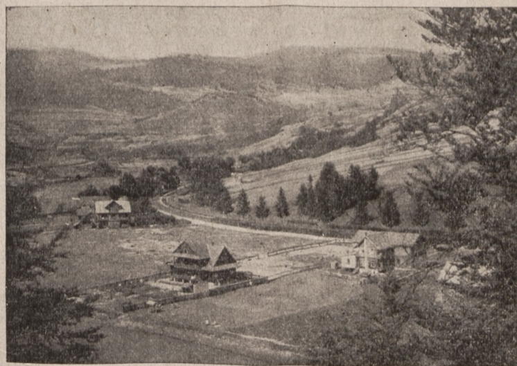
Piękny krajobraz Sądeczyny