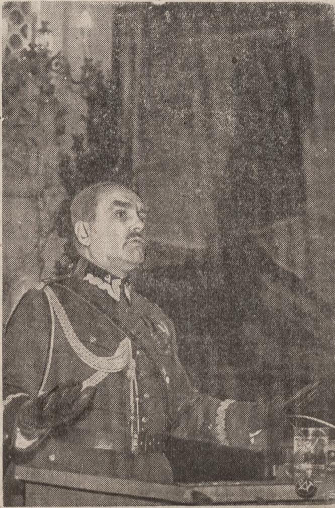
P. Premier gen. dr Felicjan Sławoj-Składkowski w momencie wygłaszania przemówienia.

obywateli. W dalszym ciągu swego przemówienia scharakteryzował Pan Premier trudności gospodarcze miast, z których najważniejszą jest sprawa