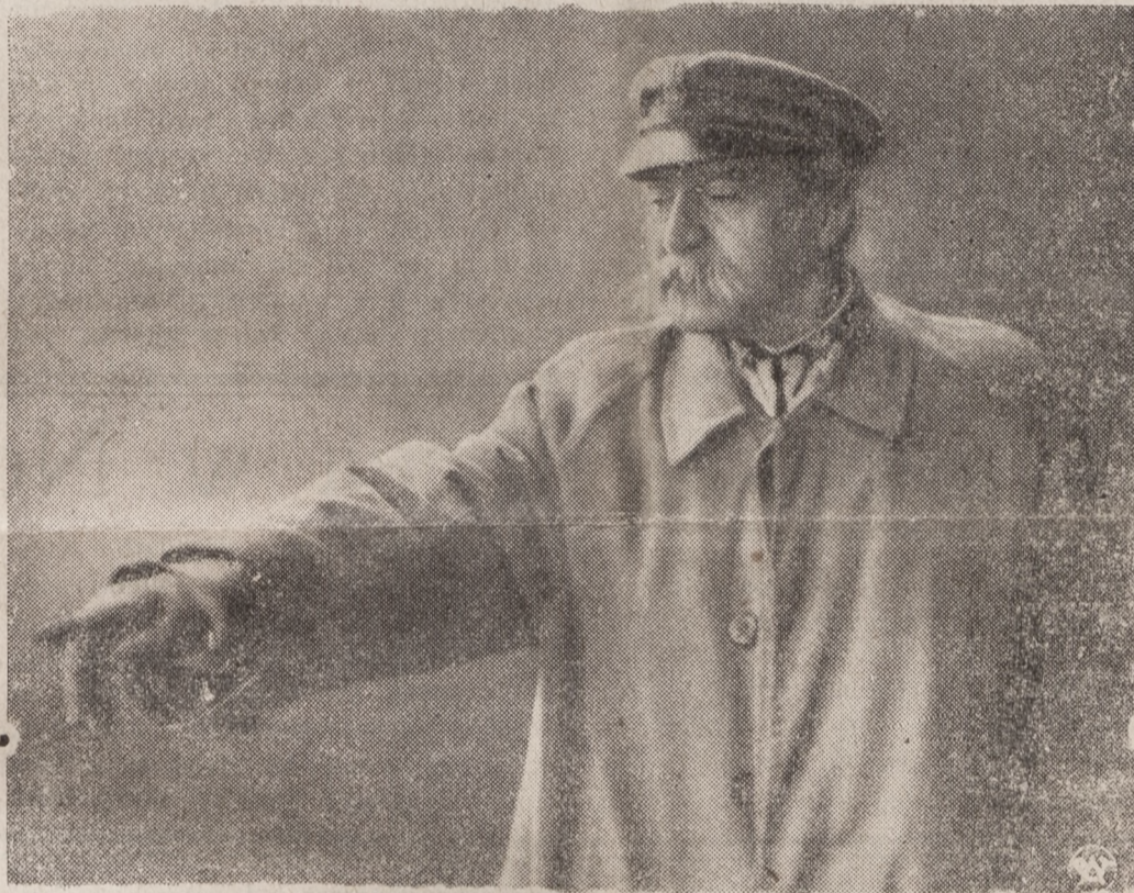
Na zdjęciu naszym nieznaną fotografią Marszałka Józefa Piłsudskiego z ostatniego okresu życia.

dobrej pracy i do Wielkości. A idąc w tę stronę, która niewątpliwie zapewni Polsce bezpieczeństwo i pomyślny rozwój — schyla serca i skłania czoła i sztandary przed Nieśmiertelnością Piłsudskiego, Jego historii i Jego władczej mocy — nawet zza grobu.