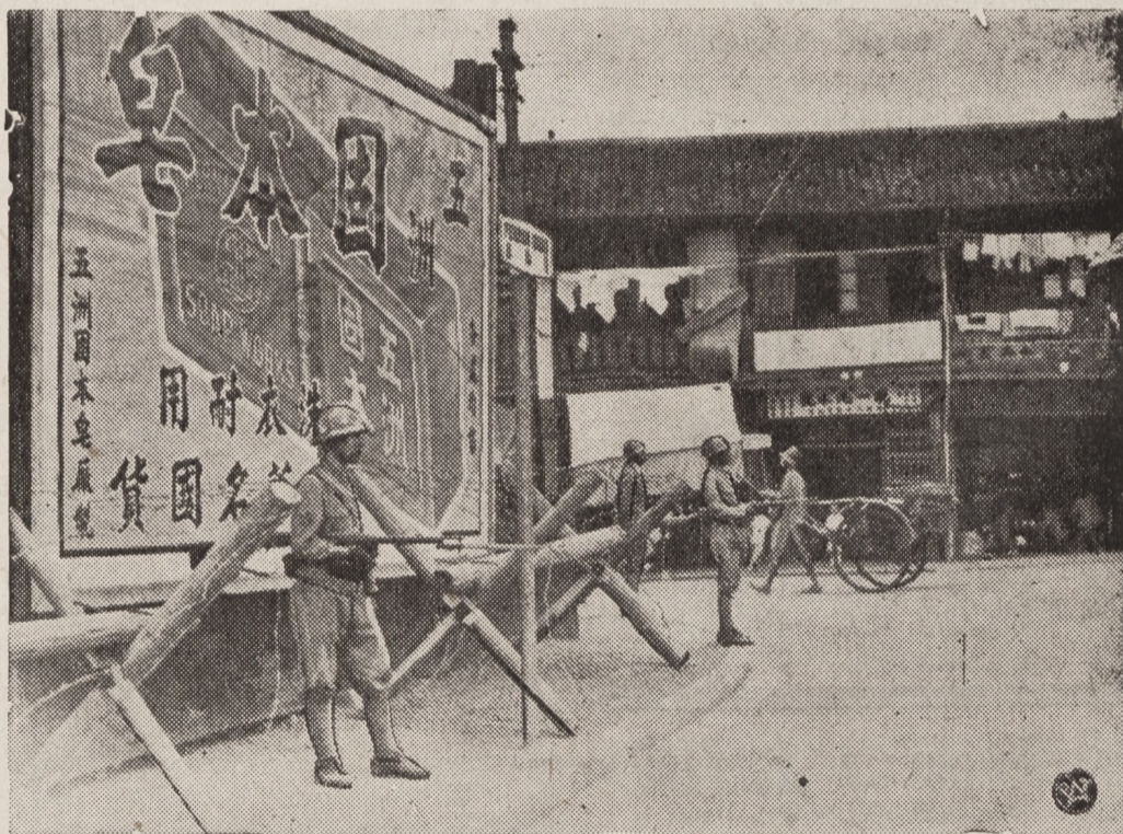
Na tym zdjęciu widzimy oddziały marynarzy japońskich, stojących za barykadami z drutów kolczastych, na jednym z opanowanych przez Japończyków przedmieść Szanghaju.