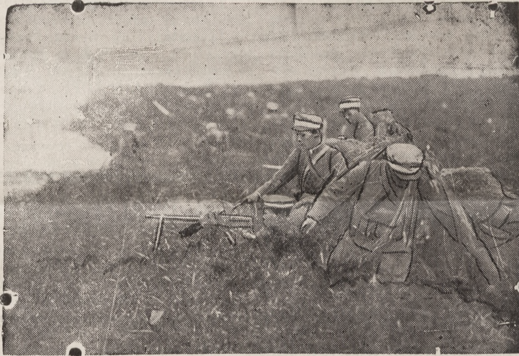
Gniazdo karabinów maszynowych na pozycjach chińskich pod Szanghajem