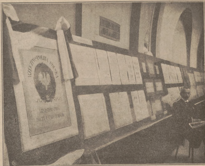
Jedna z sal wystawowych zawierająca ekspozycję Ministerstwa Poczty i Tele- grafów.

WIELKI TRIUMF FILATELISTYKI POLSKIEJ. — MIĘDZYNARODOWA WYSTAWA ZNACZKÓW POCZTO- WYCH W GENEWIE. (3—12.IX.1922).