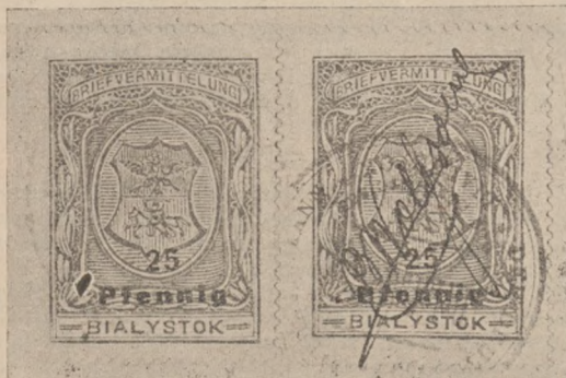
ZNACZKI POCZTOWE NIEMIECKIEGO URZĘDU POWIATOWEGO W BIAŁYSTOKU.

Do artykułu w Nr. 6—7 z 15 lipca Nowego Filatelisty.