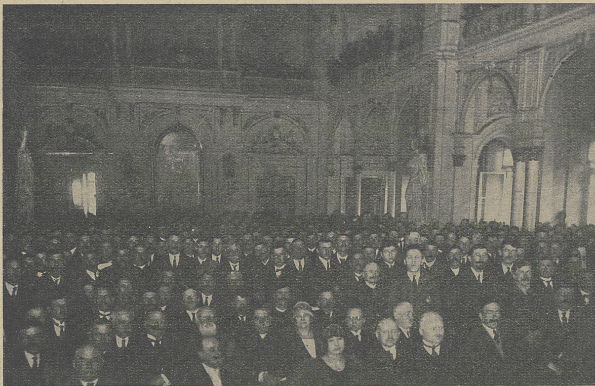
Sala Obrad Rady Miejskiej w czasie zjazdu,

Z powodu tak olbrzymiego zjazdu, wielka Sala C. T. R. okazała się zbyt małą dla obrad, to też przeniesiono je do gmachu Rady Miejskiej i tam z trudno-