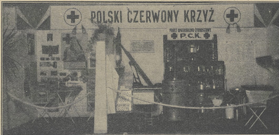
Wzorowo urządzony punkt opatr.-ż;wność. P. Cz. K. oraz dział propagandowy ilustrujący poszczególne zadania i prace T-w.

Równocześnie należy podkreślić zwrócenie ze