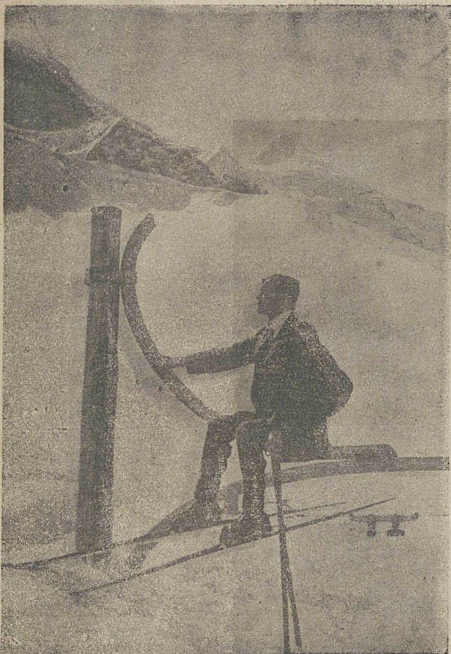
Jednym z najbardziej rozpowszechnionych sportów górskich jest jazda na specjalnych długich łyżwach drewnianych—ski. Fotografia powyższa przedstawia wycieczkę na nich w Wysokich Alpach w Szwajcarii.