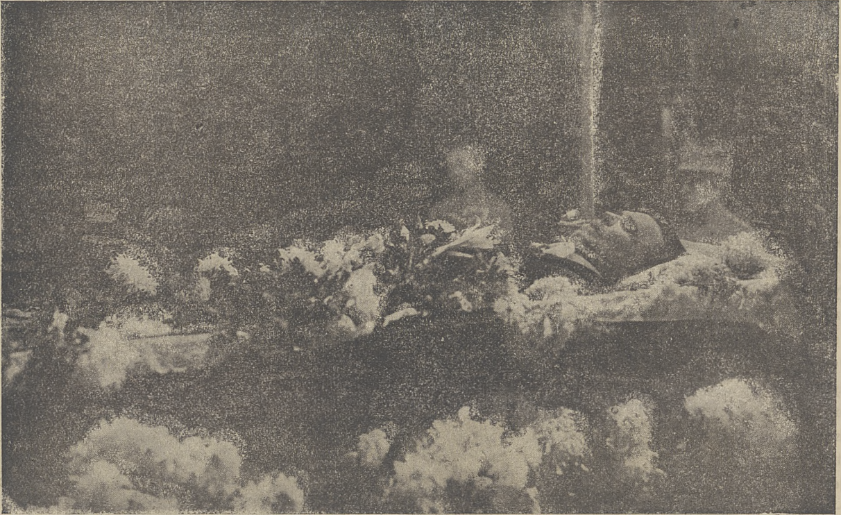
Zwłoki Władysława Reymonta w trumnie.