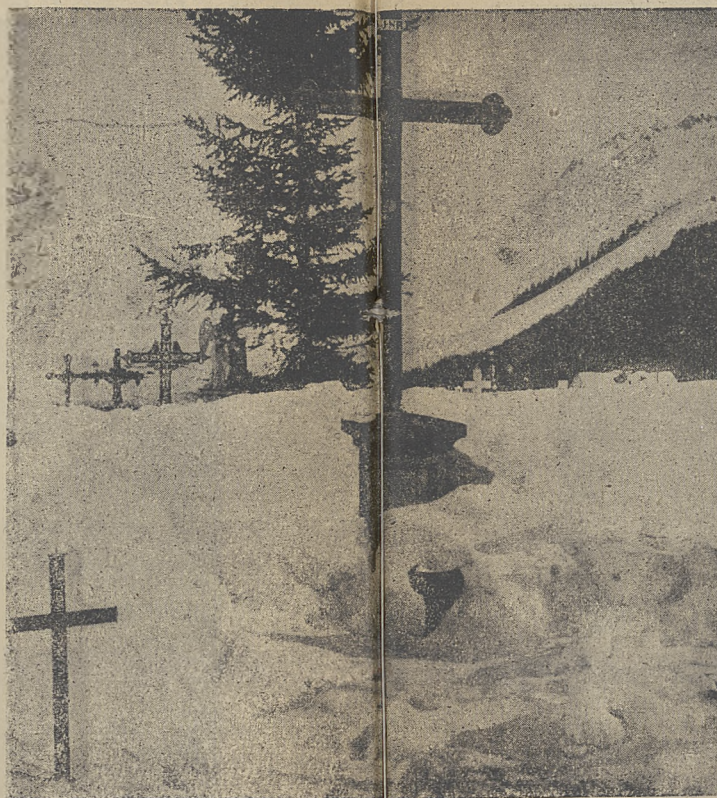
Cmentarz w Idyll koło Hasenthal zasypany śniegiem.