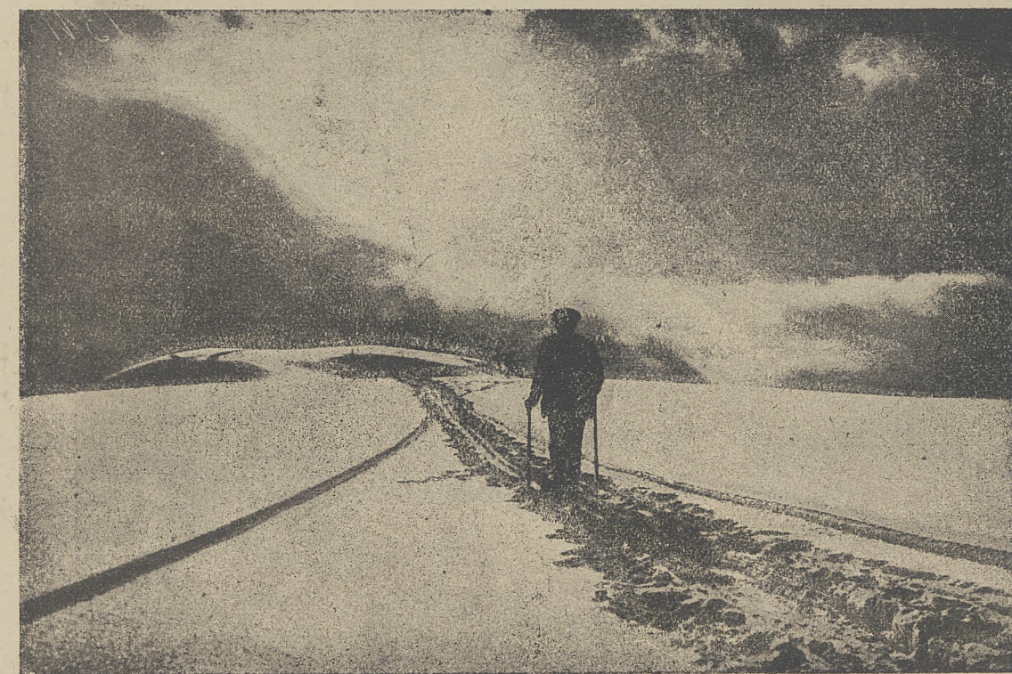
Po zachodzie słońca. — Samotny wędrowiec na pustyni śnieżnej.