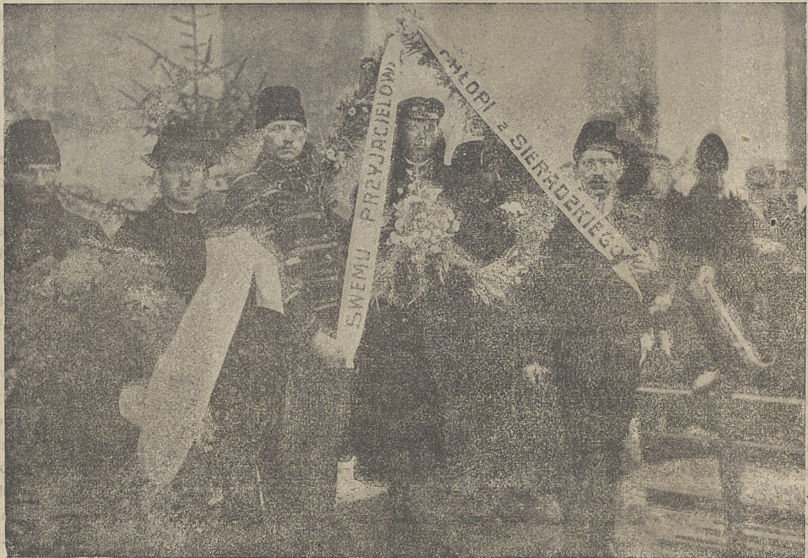
Delegacje włościańskie z wieńcami.