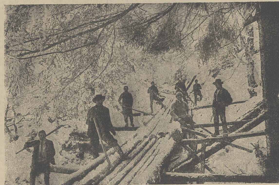
Transport drzewa w Wysokich Alpach.