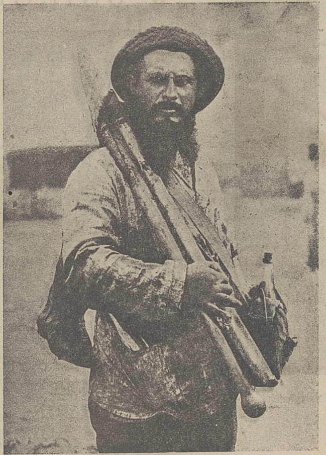
Rolnik - chasyd.

w dniu 8 b. m. minister Przemysła i Handlu, p. Osiecki, otworzył Wystawę Palestyńską w Warszawie w obecności przedstawicieli władz, instytucji, prasy, itd. Ma ona rzekomo na celu nawiązanie stosunków handlowych Polski z Palestyną, lecz w istocie swej jest propagandą prac organizacyj sjonistycznych. W szeregu pokoi i sal Hotelu Paryskiego zebrano wielką ilość ciekawych i zajmujących eksponatów, przedstawiających warunki pracy żydów w Palestynie, rezultaty osiągnięte w zakresie kolonizacji żydowskiej, stosunki gospodarcze, itd. Wystawa posiada materiał bogaty i zgrupowany bardzo starannie. Zwiedzających uderza zupełnie prawie pominięcie języka polskiego na wystawie, — to też dziwimy się, że polski minister, oraz przedstawiciele władz rządowych i komunalnych wzięli udział w jej otwarceniu, nie przekonawszy się uprzednio, czy obecność ich nie naraziła godności Państwa Polskiego.