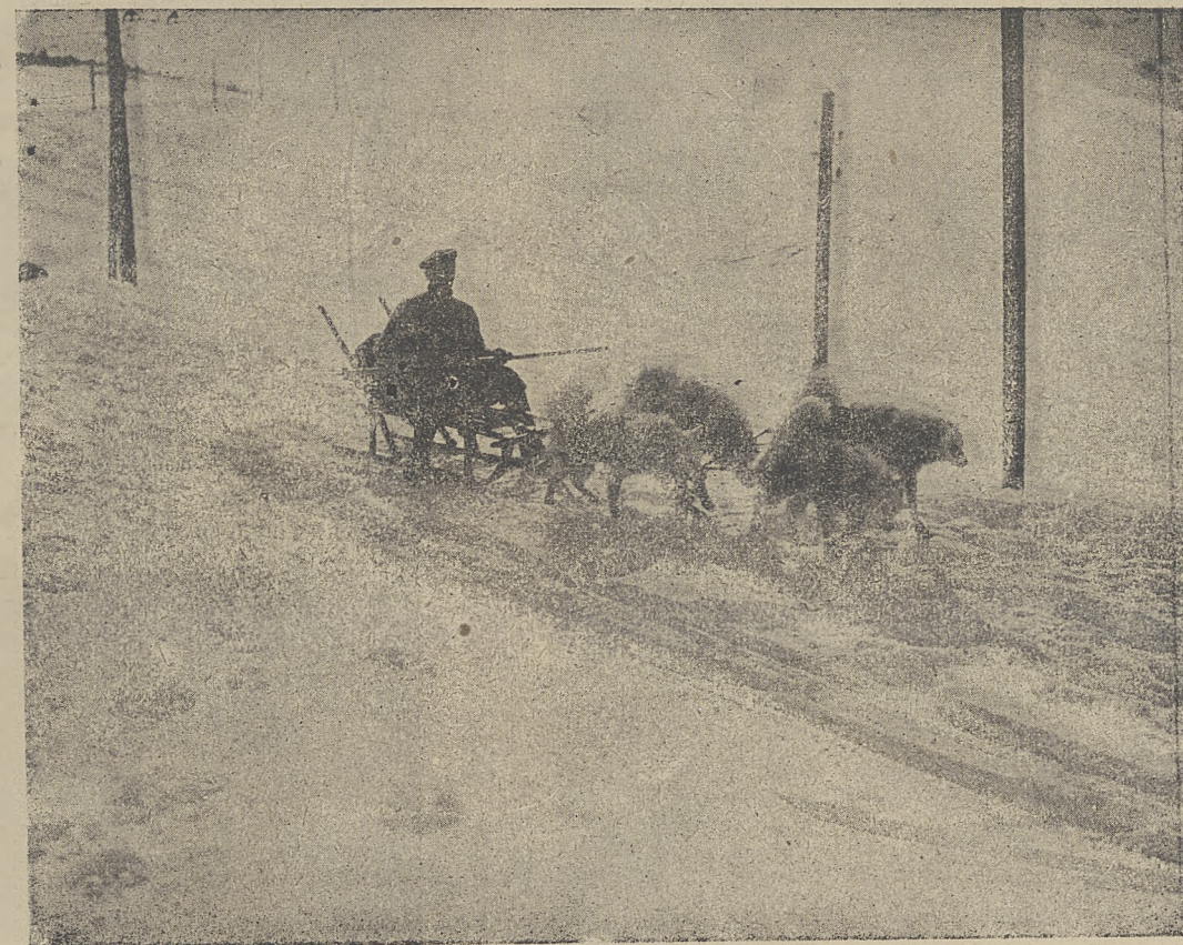
W chwilach, gdy wszystkie drogi są pozasypywane, jedynym pojazdem, jaki może się przedostać przez zasypane śnieżne — są sanie zaprzężone w psy. Widzimy tutaj, jak taki psi zaprzęg ciągnie po śnieżnej drodze sanki z pocztą.