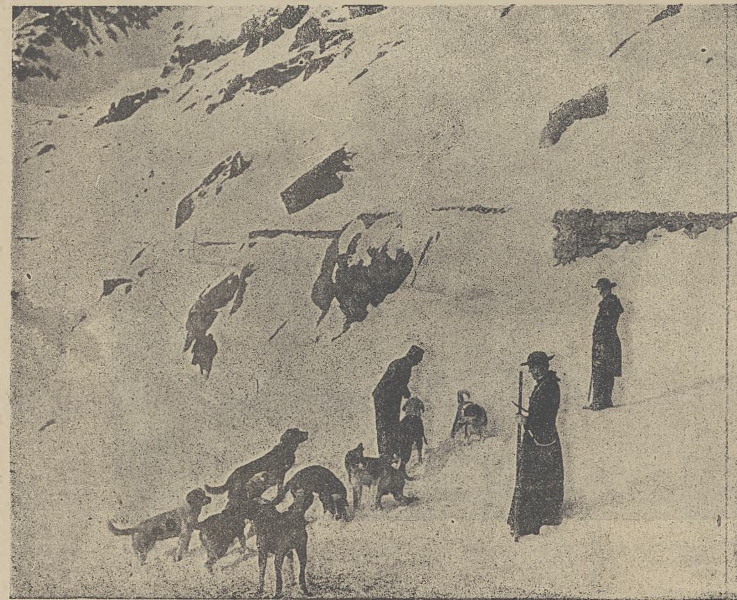
Wysyłanie słynnych psów sanbernardów w poszukiwaniu za zaginionymi podróżnikami. Na górze Św. Bernarda znajduje się klasztor imienia tego świętego. Tamtejsi zakonnicy zajmują się odnajdywaniem zabłąkanych i zasypanych podróżnych.