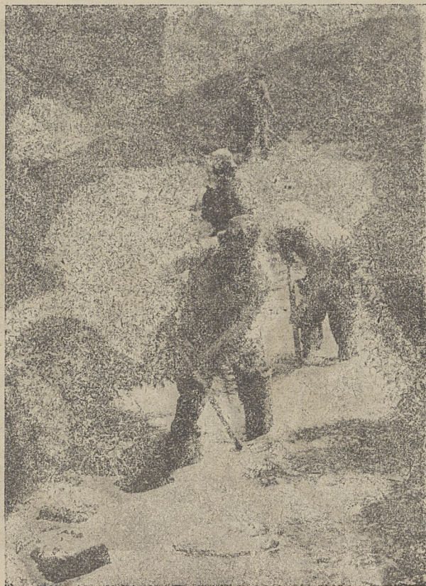
Odwadnianie moczarów pod uprawę.