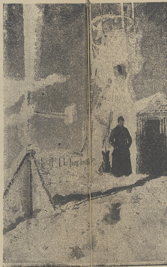
Obserwatorium Astronomiczne zasypane śniegiem i pokryte lodem.