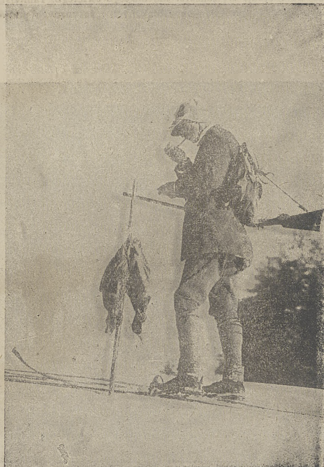
Człowiek musi się zawsze przystosować do przyrody. W błotach pińskich myśliwy zamiast butów nakłada łapcie z łyka, zaś w Szwajcarii musi być on równocześnie dobrym myśliwym i jeźdźcem na ski. Połowanie na jezioro St. Moric.