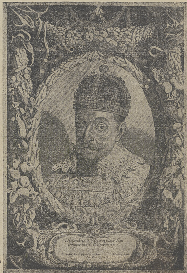
Zygmunt III Waza.