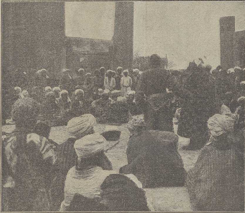
Samarkanda — Modlitwa derwiszów.

Podkreślić należy również staranne wydanie książki, co dzisiaj tak rzadko się zdarza.