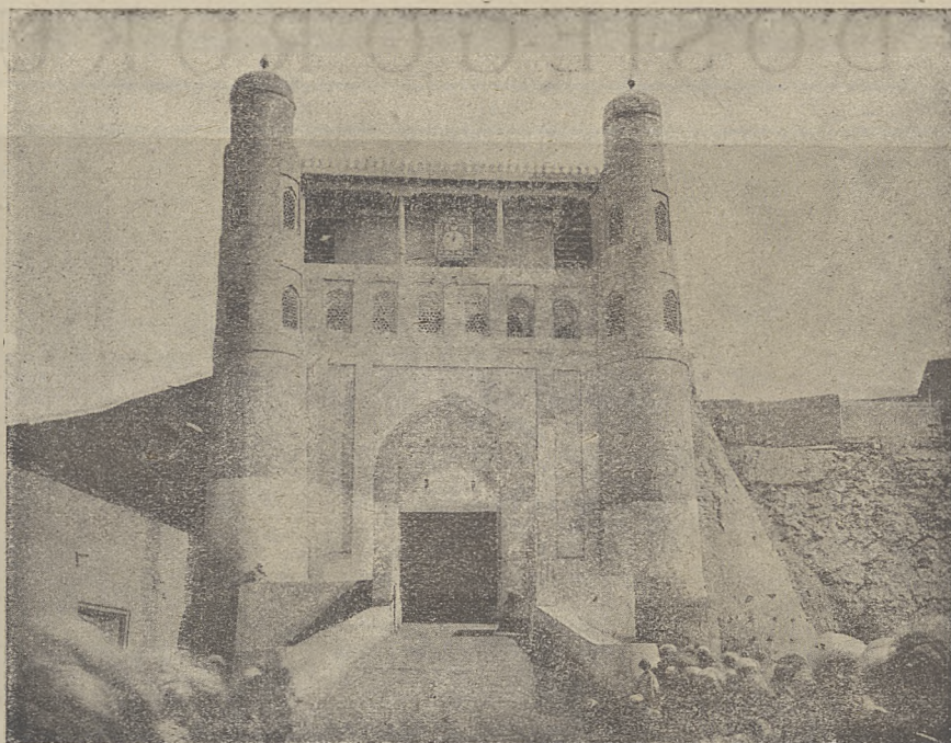
Czardżuj — Wjazd do palacu „beka”

Zalet książki jest niemało. Naprzód zaś sama forma opowiadania, potoczna, barwna, nierzadko zaprawiona doskonałym humorem. Po tem ciepły, serdeczny jakiś stosunek do człowieka Wschodu muzułmańskiego, wrażliwość na je-