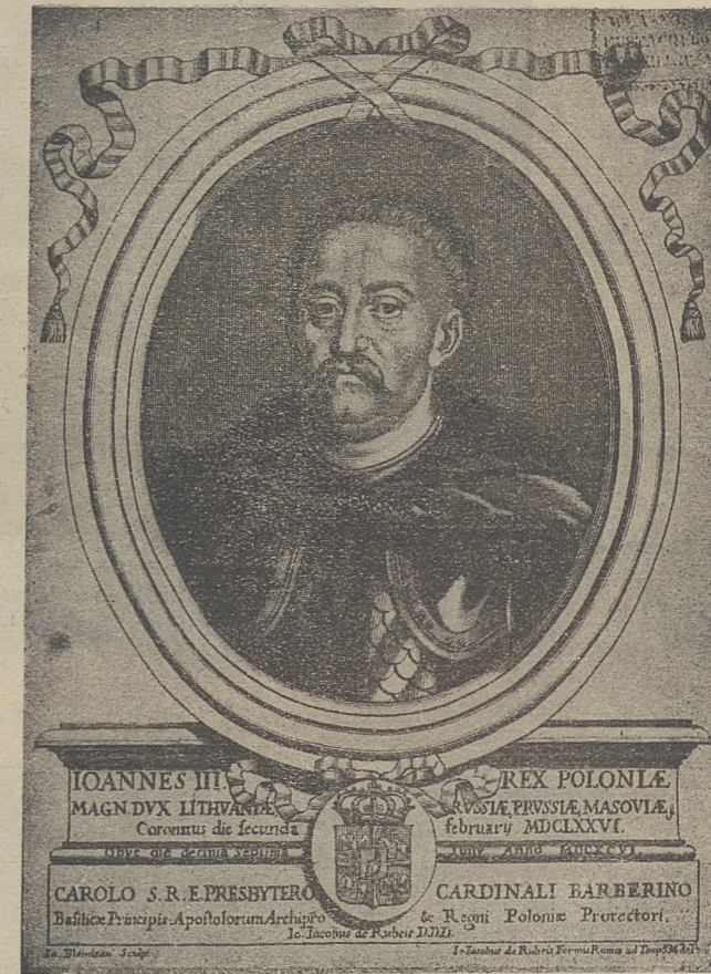
Jan III Sobieski.