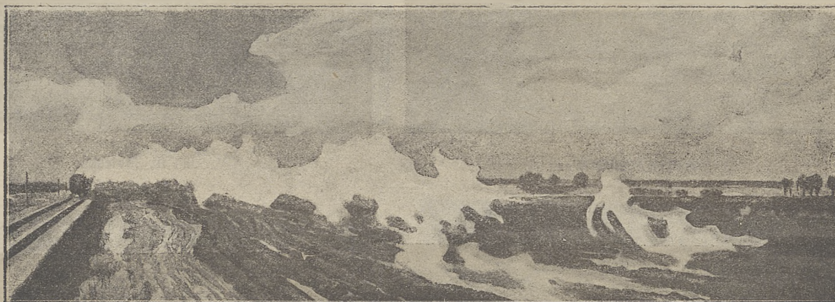
Polski krajobraz jesienny.