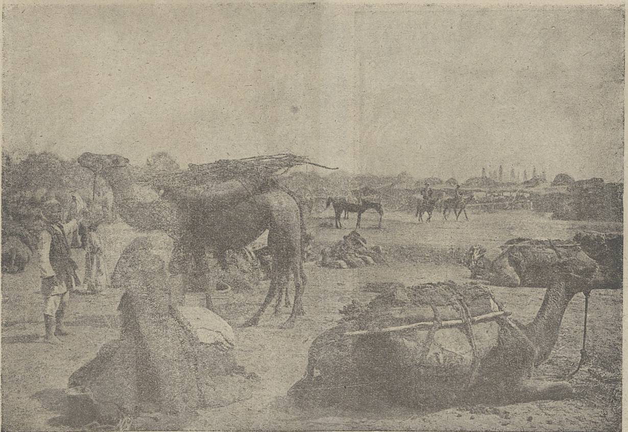
Karawana na postoju.