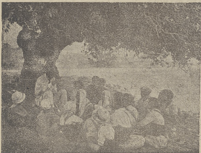
Cheder pod gołem niebem