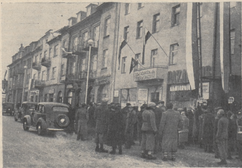
Biuro turystyczne L.P.T. w Zakopanem

Rozkład zawiera wszystkie bezpośrednie połączenia z Zakopanem z całej Polski, ze szczególnym uwzględnieniem szeregu pociągów dodatkowych, wprowadzonych specjalnie na czas FIS na odcinku Kraków — Zakopane. (z).