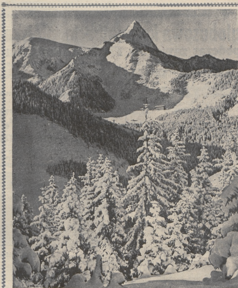
Giewont i Kalatówki z Bocznia

Nie prędko będzie można w Polsce zobaczyć po raz drugi imprezę zakrojoną na tak olbrzymią skalę!