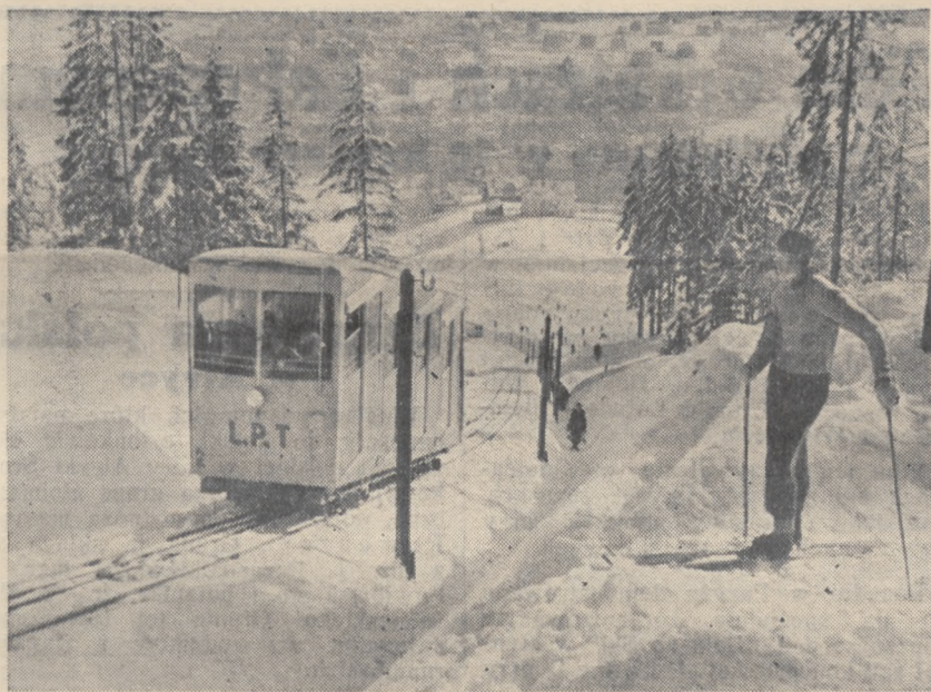
Wagon Kolej Widokowej w drodze ku szczytowi

Pod Gubałówką tło. Dolna stacja kolejki widokowej od rana do wieczora w ciągłym obłężeniu.