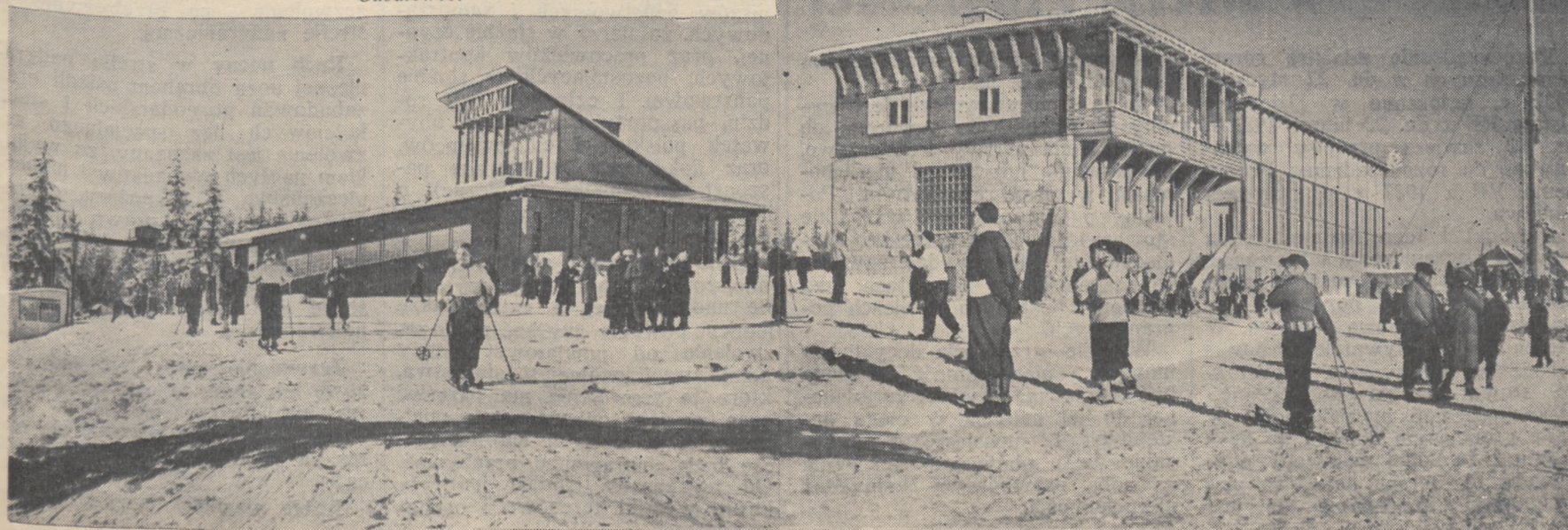
Szczytowa stacja Kolej Widokowej i nowoczesny gmach restauracji na Gubałówce.

Kolejka widokowa zdała z odznaczeniem swój wstępny egzamin!