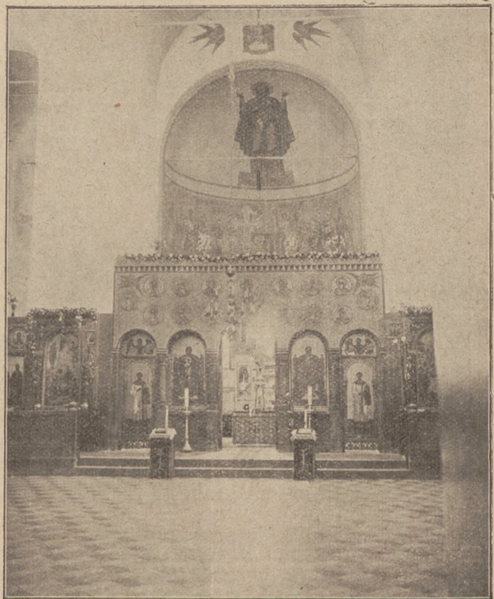
Кафедра кн. Мстислава во Владимірѣ Вольнскомъ.