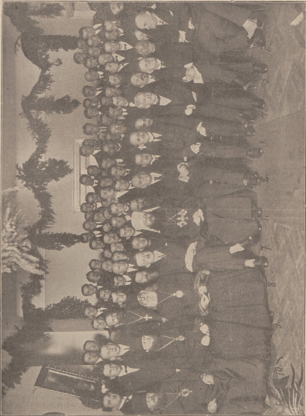
1) Высокпреосвященный Митрополитъ Діонисій. 2) Министръ Исповѣданій и Народнаго Просвѣщенія Д-ръ Добруцкій. 3) Ректоръ Варшавскаго Университета Профессоръ Д-ръ Болеславъ Гриневецкій. 4) Предсѣдатель Организационной Комисси Православнаго Богословскаго Отдѣла Варшавскаго Университета, 5) Ректоръ Университета, Профессоръ Д-ръ Кржишталовичъ. 6) Ректоръ Варшавскаго Университета Профессоръ Д-ръ Игнатій Лысковскій. 7) Деканъ Юридическаго Факультета Варшавскаго Университета Профессоръ Д-ръ Евгеній Яра. 8) Директоръ Департамента Исповѣданій Министерства Исповѣданій и Народнаго Просвѣщенія Казиміръ Окуличъ. 9) Высокпреосвященный Архіепископъ Θεодосій. 10) Преосвященный Епископъ Александръ. 10) Преосвященный Епископъ Алексій.