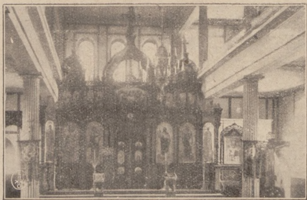
Православная церковь въ Торуні. Внутренній видъ.