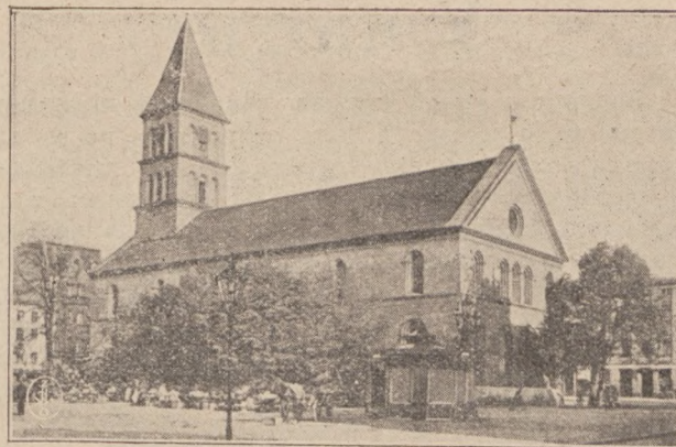
Православная церковь въ Торуні. Внешній видъ.

Новоосвященный храмъ взятъ въ пятилѣтнюю аренду Торунскимъ Православнымъ Братствомъ отъ мѣстнаго евангелическаго прихода. Только полгода тому назадъ было приступлено къ переговорамъ. Много потребовалось отъ Правленія Братства усилій, заботъ и трудовъ. Но энергія и настойчивость лицъ, есецѣло посвятившихъ себя идеѣ созданія храма, осуществила желаніе всѣхъ православныхъ Торуня и окрестностей. При помощи членовъ Братства, добровольныхъ жертвователей и кружечныхъ сборовъ въ церквахъ были преодолены препятствія матеріальнаго характера. На собранныя средства былъ внесенъ требуемый залогъ и кирка была приспособлена къ православнымъ богослуженіямъ: сняты лавки и поставлены иконостасы.