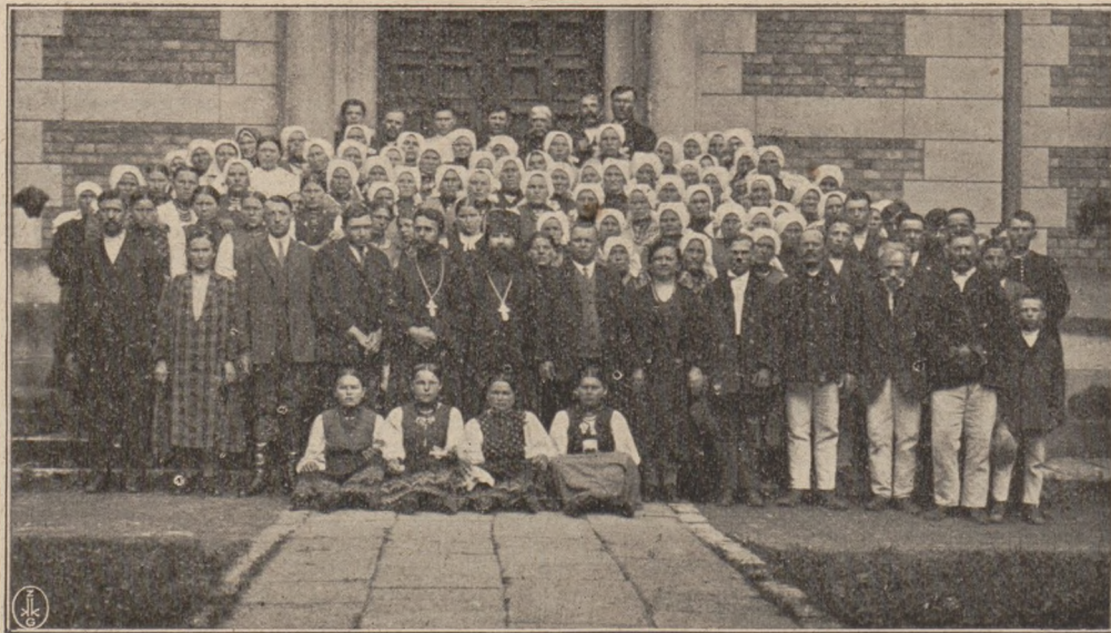
Нъ статьѣ „Первое паломничество православныхъ карпатороссовъ въ Почаевъ“.

настолько привлекали вниманіе Львовянъ, что даже трамвайное движеніе бывало останавливаемо въ тѣхъ мѣстахъ, куда проходили паломники съ православнымъ священникомъ впереди.