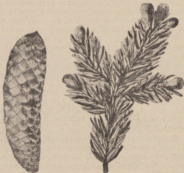
Рис. 1. Молодой еловый побѣгъ и шишка.

Ель (Рис. 1) относится къ породамъ нетребовательнымъ по отношенію къ свѣту; это такъ называемая тѣневыносливая порода. Поэтому на сѣверѣ, гдѣ относительно небольшое солнечное освѣщеніе, она образуетъ мощные еловые лѣса большой производи-