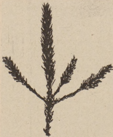
Рис. 3. Шелкопрядь монашенка Боковая вѣтвь молодой елочки, об- лѣденная взрослыми гусеницами.