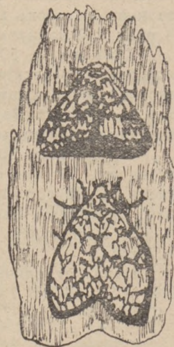
Рис. 3б. Бабочка; выше самецъ, ниже самка.

еть съ такими же тѣнелюбами, какъ она, т. е. съ букомъ, пихтой и т. д.