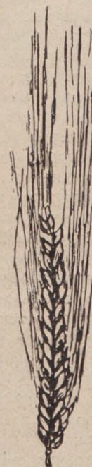
Рис. 4. Твердая пшеница.

мые, очень распространены въ Западной Европѣ и заходятъ далеко на сѣверъ. Бархатистыя гирки требуютъ сравнительно сухого климата и поздно созреваютъ. При уборкѣ во влажное время трудно сохнуть, такъ какъ на волоскахъ пленокъ задерживается влага и зерна отъ этого часто прорастаютъ въ колосѣ.