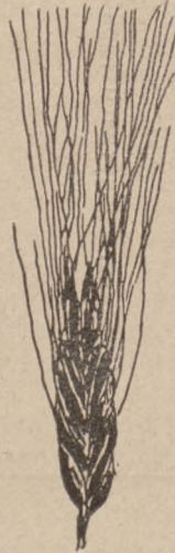
Рис. 5. Польская пшеница.

Чтобы достигнуть большей кустистости ржи, нужно 1) тщательно отбирать посѣвныя сѣмена; 2) пораньше сѣять и сравнительно рѣдкимъ посѣвомъ,