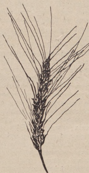
Рис. 2. Красноколоска.