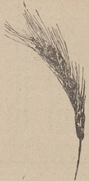
Рис. 6. Рожь.

чтобы рожь могла выкуститься съ осени и въ изобиліи пользоваться свѣтомъ, который необходимъ для кушенія; 3) хорошо удобрять поле и 4) почва должна быть достаточно плодородна и сыра. Хорошая кустовка, при соблюденіи вышеперечисленныхъ условій можетъ развить до 10 побѣговъ зерна. Къ недостатку кустовокъ нужно отнести легкое осыпаніе зеренъ при уборкѣ, такъ какъ зерна у нихъ болѣе выпираютъ изъ пленокъ, чѣмъ у обыкновенной ржи; въ этомъ онѣ аналогичны гиркамъ, осыпающимся легче усатокъ.