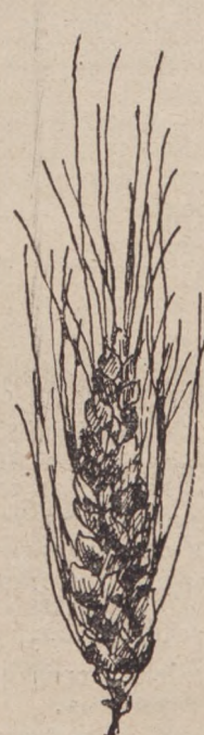
Рис. 3. Англійская пшеница