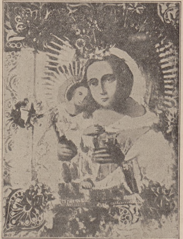
Благодатная Икона Божіей Матери „Взысканіе пегибшихъ“, обновившаяся въ с. Бѣлевѣ на Волыни.

Вы говорите, что единеніе Церквей составитъ