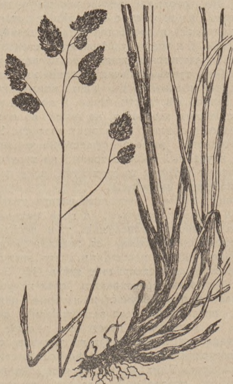
Рис. 4. Ежа.

Ежа сборная (Рис. 4) въ дикомъ состояніи растетъ въ тѣнистыхъ мѣстахъ на поляхъ, лугахъ и