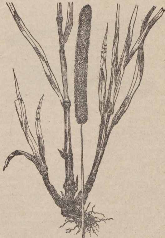
Рис. 1. Тимофеевка.

Кормовыя травы введенныя въ сельскохозяйственную культуру принадлежатъ главнымъ образомъ къ семействамъ злаковыхъ и мотыльковыхъ или бобовыхъ растений. Изъ перваго семейства особеннымъ вниманіемъ хозяевъ пользуется тимофеевка (Рис. 1), встрѣчающаяся въ дикомъ состояніи на лугахъ съ суглинистой и глинистой почвой умеренной влажности. Корневая система ея хорошо развита, вслѣдствіе этого она прочно и глубоко укореняется и потому довольно сносно переноситъ непродолжительныя засухи, но сильныя засухи ее губятъ. Она хоро-