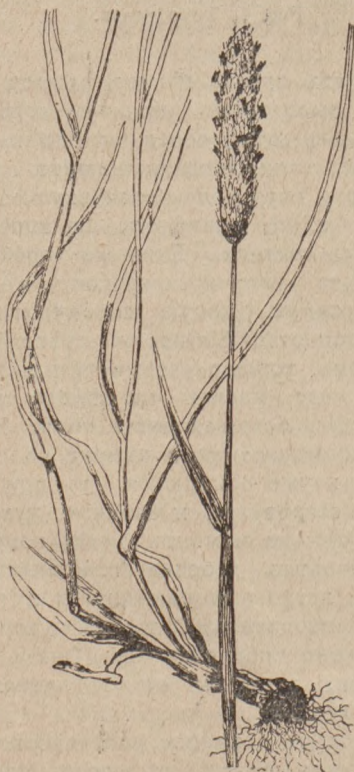
Рис. 3. Лисохвостъ.

Слѣдующая кормозая трава лисохвостъ (Рис. 3), въ дикомъ состояніи встрѣчающійся на такихъ же земляхъ, какъ и тимофеевка, растетъ хорошо и на торфяникахъ; цвѣтетъ раньше тимофеевки, быстро отцвѣтаетъ и быстро созреваетъ, такъ что нужно очень торопиться съ укосомъ, чтобы онъ не перезрѣлъ. Сѣно еще питательнѣе тимофеевскаго, но если упущенъ моментъ укоса, то можно получить жесткое, похожее на солому, грубое сѣно. При посѣ-