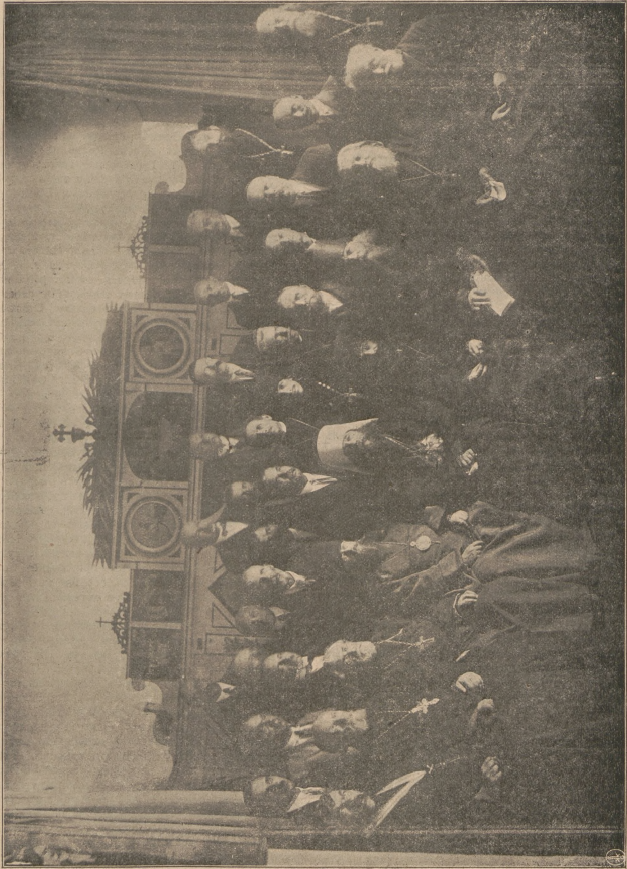
Вторая Сессия Митрополитального Совета 22-24 августа 1928 года.