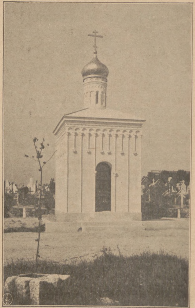
Православная Часовня Памятникъ на русскомъ участіи городского кладбища въ гор. Загребѣ (Югославія).

На границѣ Курашскаго прихода грядущая Богоматерь съ любовью и торжественно срѣтается Курашскимъ крестнымъ ходомъ, во главѣ съ настоятелемъ Курашской церкви о. Владиміромъ Новосадскимъ, привѣтствовавшимъ Божію Матерь глубоко-прочувствованнымъ словомъ—сознаніемъ своего недо-