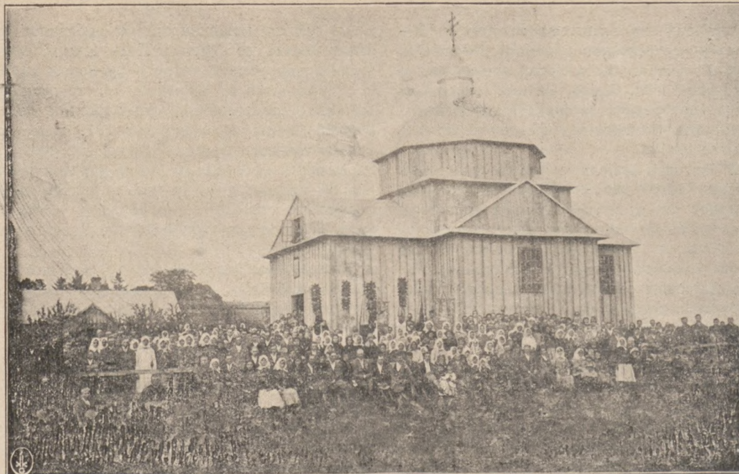
Православный храмъ въ с. Норчинѣ, Сокальскаго уѣзда, въ Галиціи. Сооруженъ прихожанами, присоединившимися къ Православной Церкви весною 1927 года, на собственные средства.

призываетъ всѣ Церкви, дабы все свое нравственное вліяніе вмѣстѣ съ Лигой Націй и собственными правительствами использовали на то, чтобы эти правительства какъ можно скорѣе приступили къ международнымъ договорамъ, необходимымъ для достиженія вышеуказанныхъ цѣлей. Наконецъ, Конгрессъ призываетъ Церкви примѣнить всѣ свои духовныя силы и воспитательное вліяніе для того, чтобы народы признали себя обязанными схранить въ будущемъ братскую солидарность и цѣлесообразный общій трудъ, отказываясь вмѣстѣ съ тѣмъ отъ своеволія въ отношеніи международныхъ обязательствъ. Церковь Христова въ основѣ безусловно принимаетъ эту святую заповѣдь, данную ей Главой Церкви въ Святомъ Евангеліи: „Ищите же прежде Царства Божія и правды Его“ (Мѣ. 7,33).