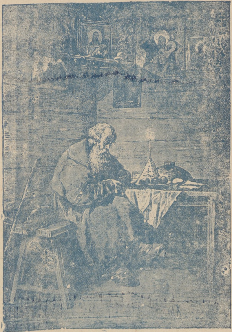
Передъ Свѣтлой Заутреней.

Не изъ келій выходятъ затворницы За черту монастырскихъ оградъ, Рамы зимнія сбросили горницы И впиваютъ полей аромать. Какъ недавно слезой опечалены И вдругъ радостью вспыхнувшій взглядъ, Какъ фалки на темныхъ проталинахъ Въ окнахъ вешнія звѣзды горятъ... Все, что есть дорогого, прекраснаго, Все, чѣмъ сладокъ домашній укладъ, Къ Дню Великому Праздника Краснаго Расцвѣло словно радостный садъ. Одаренъ золотыми заботами Православной семьи обиходъ, И не даромъ Господней работою Трудъ хозяйки въ Страстную слыветъ. Притомились, родныя, умаялись, Приходилось не разъ тяжело, Богъ помогъ — обрядились, управились, И на сердцѣ легко и свѣтло. Дышать праздникомъ комнаты чистыя, Перемытыя стекла блестятъ, И бѣлы занавѣски сквозистыя, Какъ невѣсты вѣнчальный нарядъ. Отъ иконъ съ золотыми окладами Льетъ свѣтлой струей благодать; Хорошо въ тишинѣ подъ лампадами Предъ Заутреней Свѣтлой дремать.