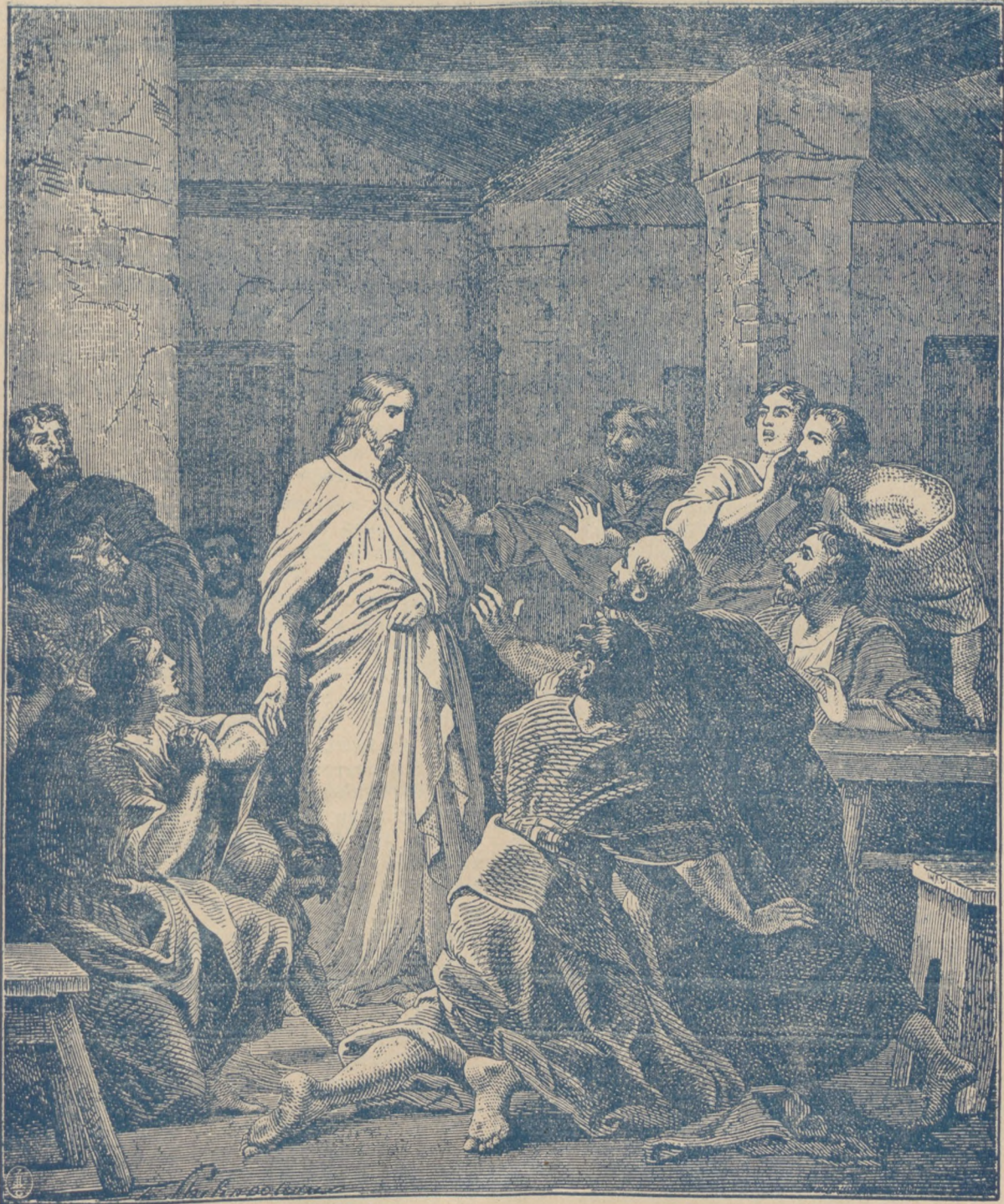
Явленіе Воскресшаго Христа 12-ти Апостоламъ въ первый день по воскресеніи.