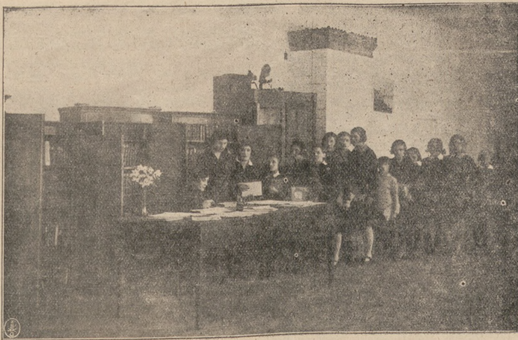
Изъ жизни Дерманской Женской Духовной Гимназіи.