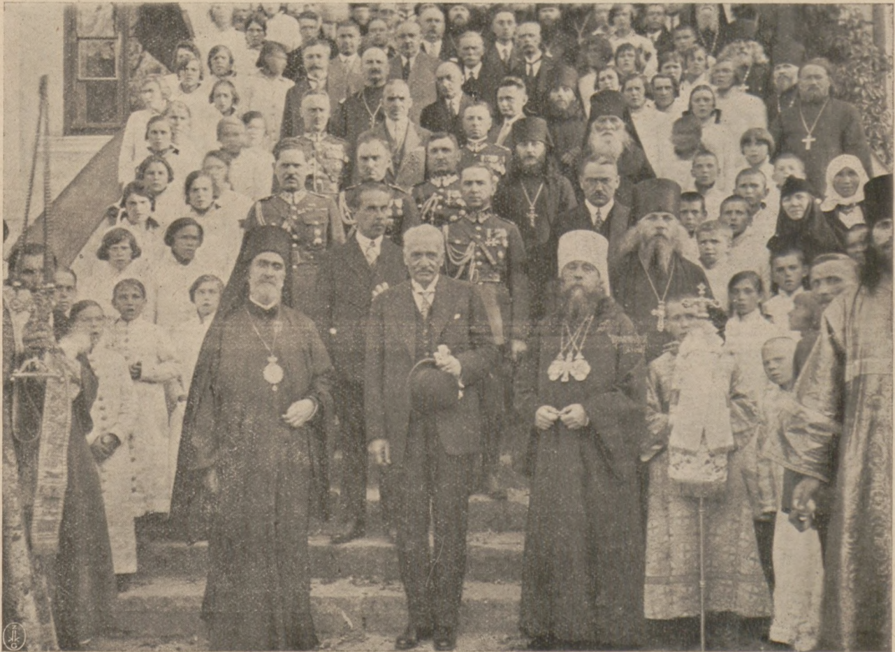
Предъ отбытіемъ Г. Президента Республики изъ Лавры. На крыльцѣ Архіерейскаго Дома.

Сопровождаемый тѣсной толпой, ищущей благословенія, благословивъ всѣхъ, Владыка Митрополитъ отбылъ въ Варшаву.