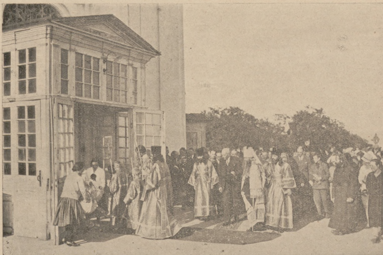
Шествіе въ Успенскій Соборъ на молебень предъ Почаевскою Чудотворною Иконою Божіей Матери.