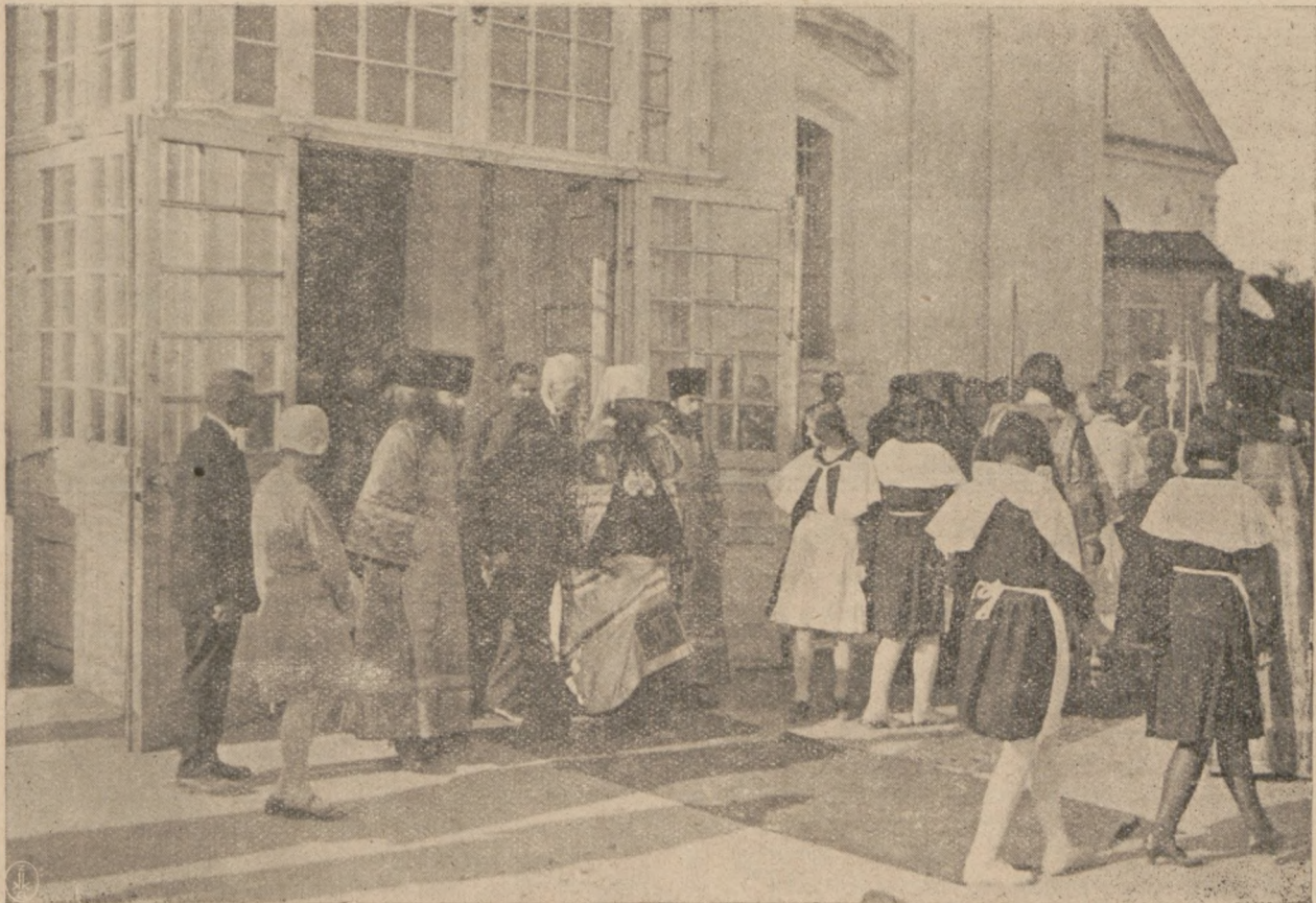
Возвращеніе изъ Успенскаго Собора въ Архіерейскій Домъ.