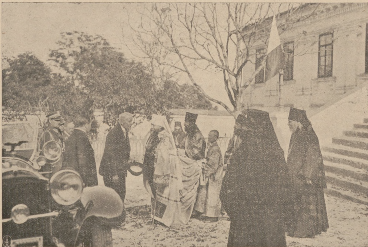
Встрѣча Его Блаженствомъ, Блаженнѣйшимъ Митрополитомъ Діонисіемъ, Г. Президента Республики у Архіерейскаго Дома.]