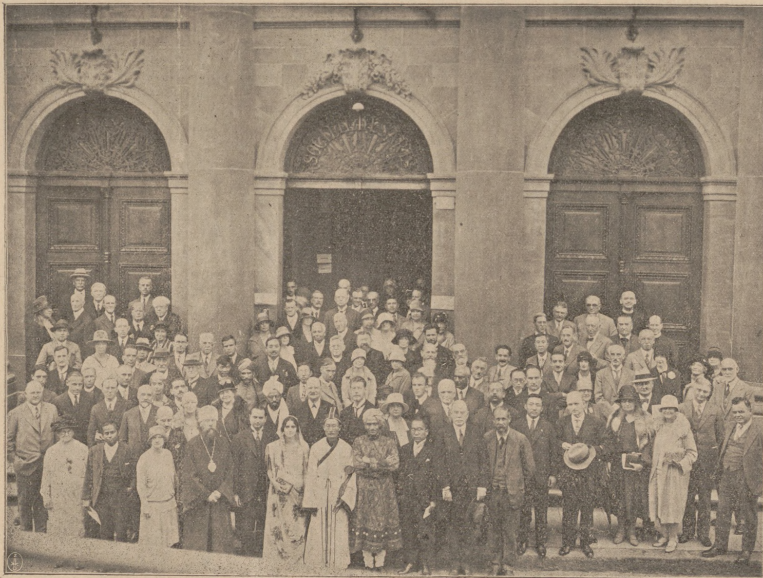
Общая группа членов Всеобщей Религиозной Конференции Мира въ Женевѣ (12-14 сентября 1928 года).