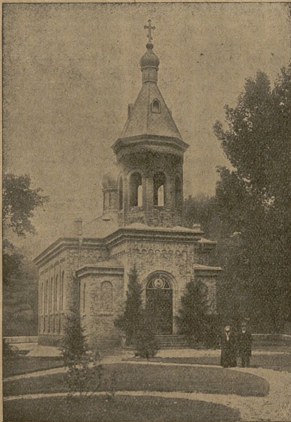
Внѣшній видъ новопостроенной церкви въ г. Калишѣ. Колокольня надъ входомъ.